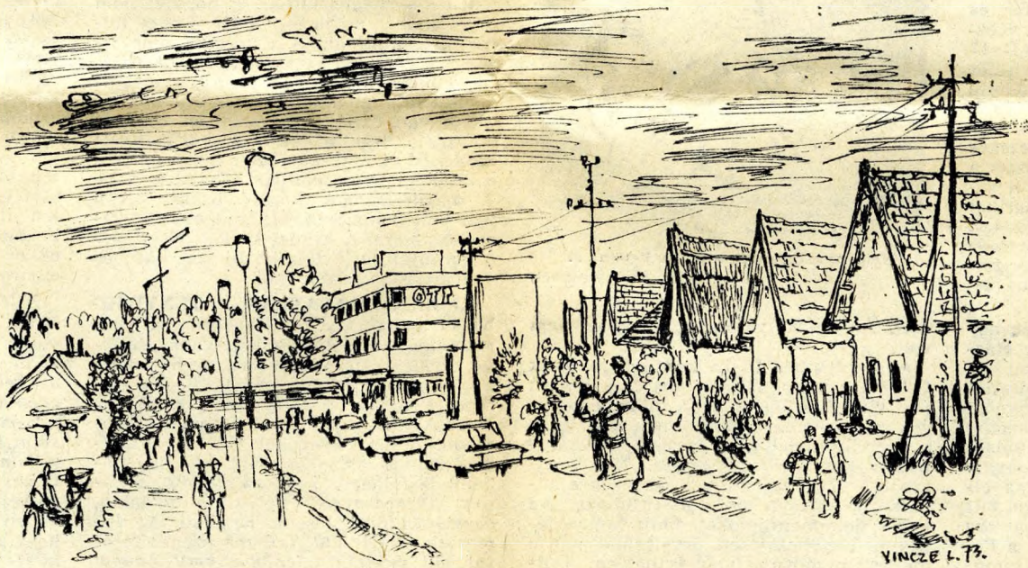
A falusi házak helyén többszintes városi lakó épületek emelkednek — (Vincze Lajos rajza)