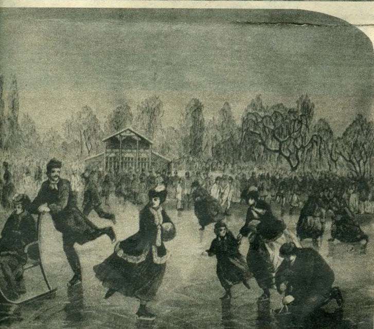
Korcsolyázás a pesti Városligetben. Rusz Károly metszete a Hazánk s a Külföld 1872. évfolyamából