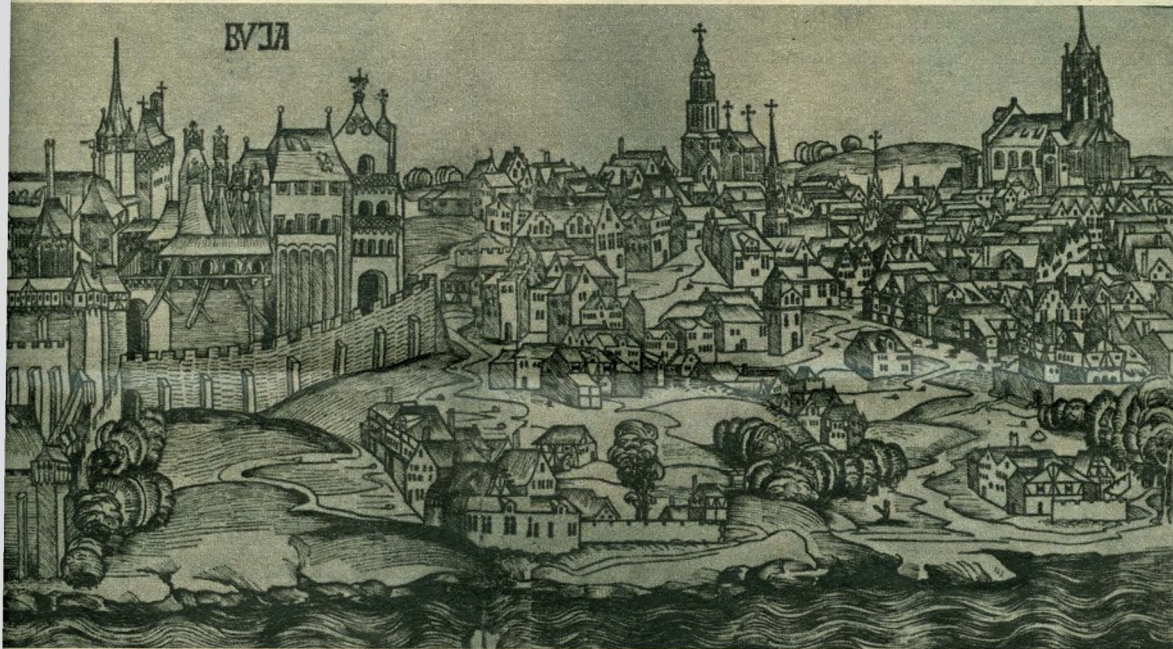
Buda első ismert ábrázolása 1493-ból. Fametszet Hartmann Schedel 1493-ban megjelent Világkrónikájából

letve festményreprodukció adatai közt az 1880. évi tervpályázat, Steindl Imre terve, az alapozás, az építkezés részletei, a bokrétaünnep, a beköltözés, sőt még az időnkénti tatarozások mozzanatai is nyomon követhetők. A külső és belső felvetelek nemegyszer segítettek a restaurátoroknak, mert a puha homokkővet szél, fagy és háború egyaránt pusztította és már csak a kép őrizte hitelesen az ablakkeretek, díszek, szobrocskák, szegletek eredeti formáját.