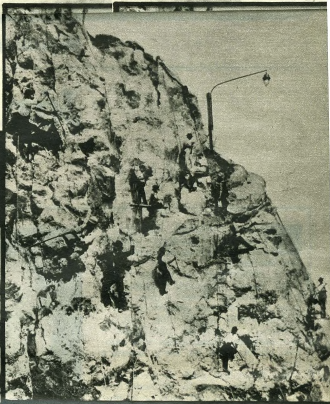
Faragják a Gellérthegy műszikláit – illusztráció Porzó (Ágai Adolf) Budapest-történeti könyvritkaságából