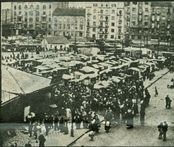
A „bolhapiac” rokonértelmű szavává lett Teleki tér