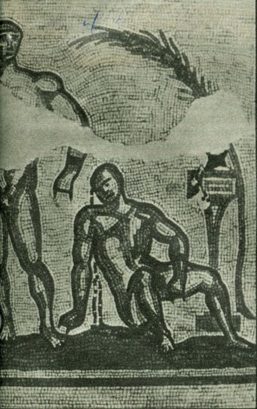
Római bokszolók mozaikon