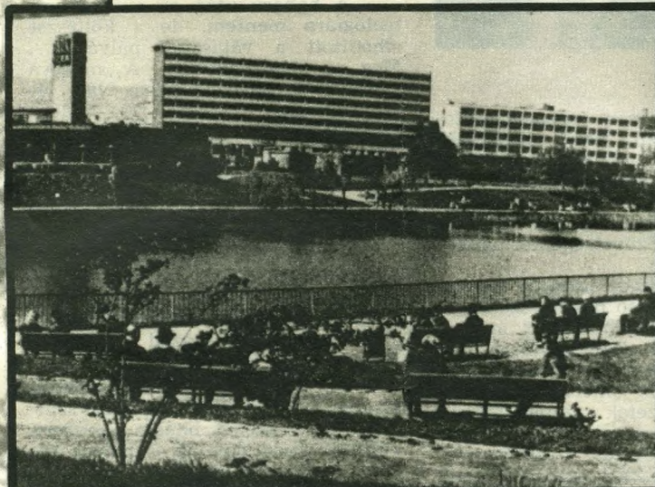
A Feneketlen-tó a 60-as években, mikor még éltek benne a halak