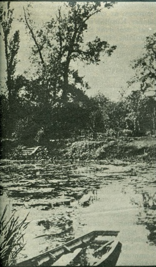
Ahol Nemecek „megfürdött”: a Fűvészkert tava