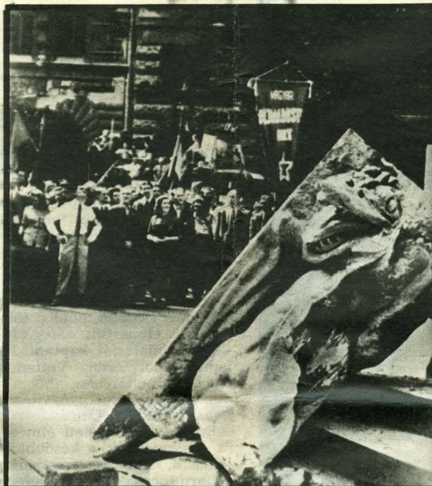
Irredenta szobrok ledöntése (újságfotó 1945-ből)