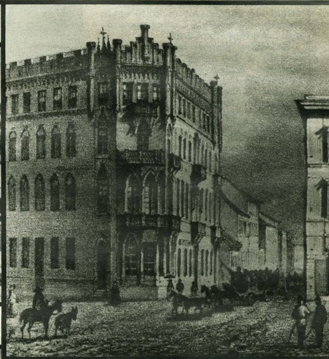
A híres-romantikus Pekáry-ház a volt Király utcában (Rohbock rajza)