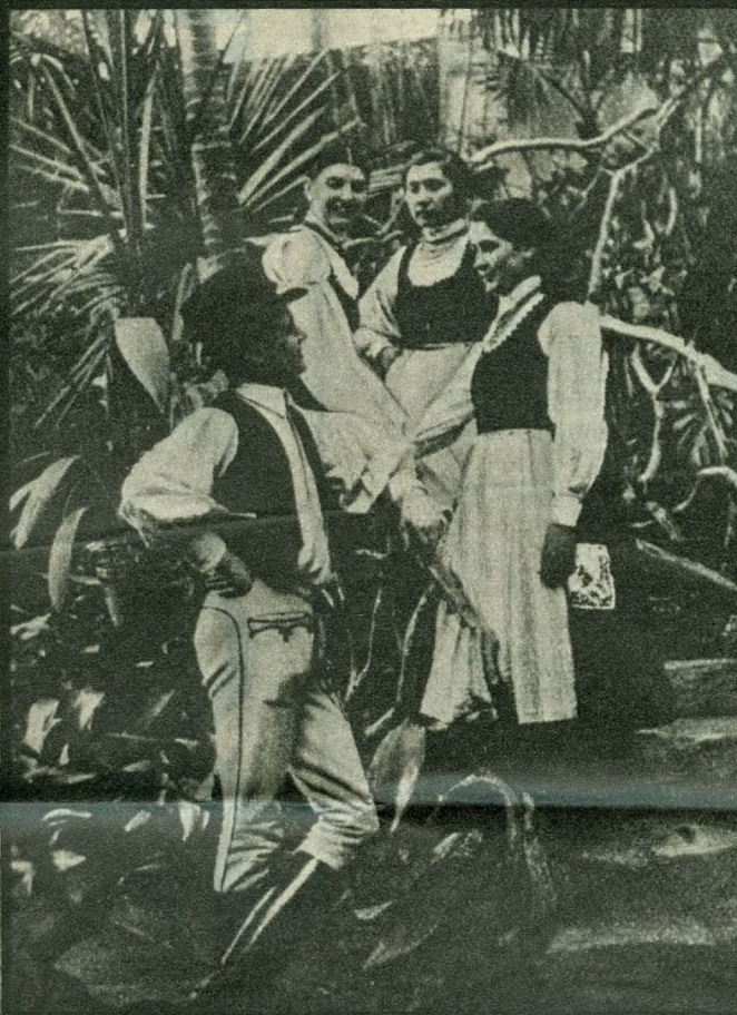
És sokkal szelídebb erdélyi menyecskék (a sajtó akkori nyelvén: „székely virágok”), a nagyobb hatás kedvéért a krokodilmedence mellett fényképezve