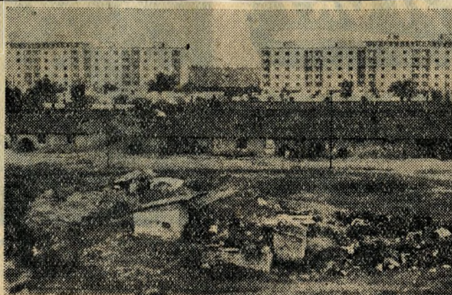
Itt még barakkos — ott, az Üllői út másik oldalán már modern házsor.