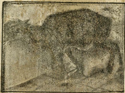
Az állatkerti muflon az operáció előtt (Alig áll a lábán, szörzete kopott)

— A műtétet követő harmadik héten a muflonon máris javulás volt észlelhető. Az