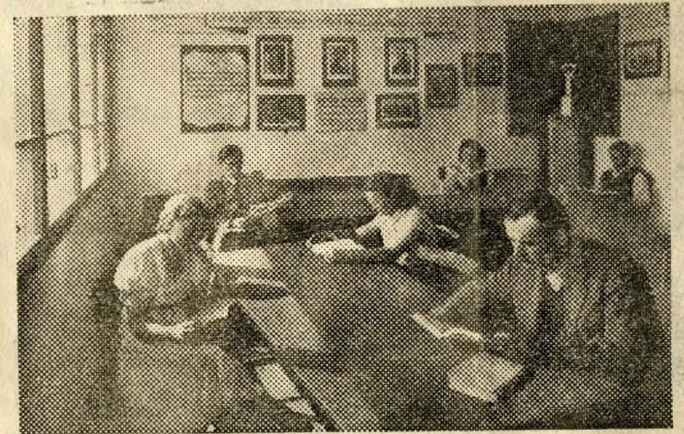
A Földalatti Vasútépítő Vállalat dombóváriuti munkásszállója, melynek „Petőfi” olvasótermében tanulnak, szórakoznak munka után a dolgozók.

a Balthyány-téri munkahelynél talajvíz tört be a függőleges aknába. A dolgozók hősiessé eredményeként a termelőmunka hétfőn újra megindult. Ugyszintén megkezdtek a földalatti gyorsvasút legújabb munkahelyén, a Moszkva-téren is a munkát. Építik a munkahely kerítését és már megkezdődött az aknasüllyesztés munkája is. A vérmezői munkahely dolgozói a legkorszerűbb robbantási módszerek segítségével eddig 670 méter hosszú földalatti folyosót építettek. Ezek a földalatti folyosók a leendő állomáson futnak majd végig. Az anyagszállítást is kitűnően megszervezték itt: óránként egy vagon anyagot szállítanak el.