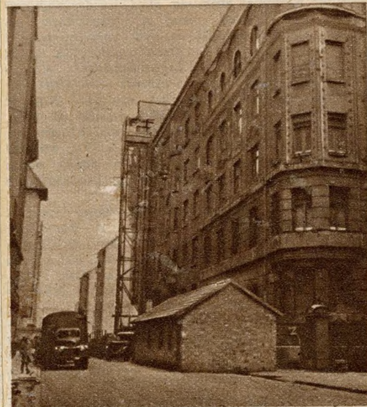
A KRESZ GEZA UTCA bérházainak tövében szintén régóta díszlik egy felvonulási lak