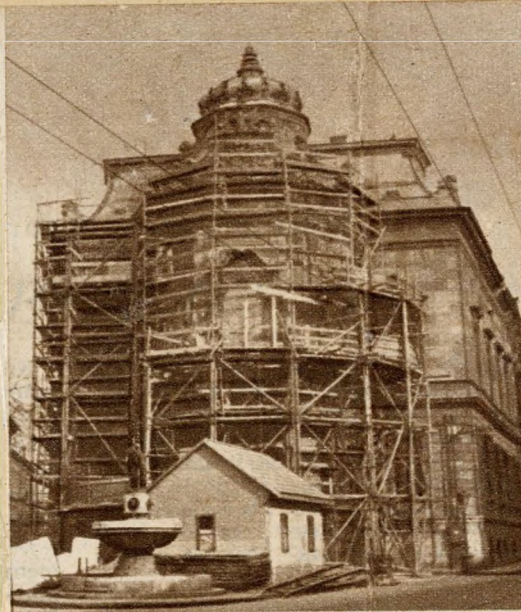
A BAROSS UTCA és a Reviczky utca torkolatában, a Fővárosi Szabó Ervin Könyvtár műemlékpala-tája előtt emelték a »városszépítés« dicsőségére ezt a kunyhót