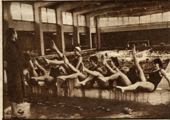
1966 októbere óta ideális körülmények között folyik az úszóoktatás a TF-en

A múlt év októberében adták át a Testnevelési Főiskola korszerű, új létesítményét, a játékcarnokkal egybeépített fedettuszodát. A tervező — Siraky Lóránd — tizenkétszeres magyar válogatott sportoló, a MÁV Tervező Intézet csoportvezető főmérnöke.