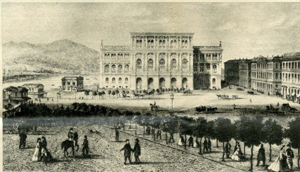
Kisvárosi idill a múlt századból. Háttérben az Akadémia, az előtérben sétáló párok és sok-sok zöld...

A központi, fővárosi funkciókat a két testvérváros már a tizenennyolcadik század második felétől együtt gyakorolta, lévén az egyik igazgatási, a másik gazdasági centrum. Együvértartozásuk, közös szerepük jogi elismerése, az 1848-as forradalomban és szabadságharcban vállatve vívott küzdelmük már 1849-ben szükségszerűen kimondotta Pest, Buda, Óbuda egyesítését, a szabadságharc bukása miatt azonban e ren-