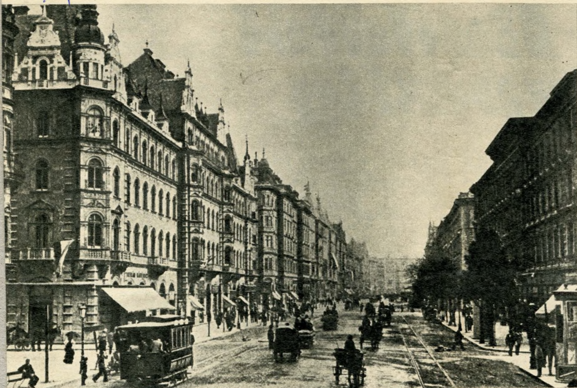
Korabeli csúcsforgalom a Körúton