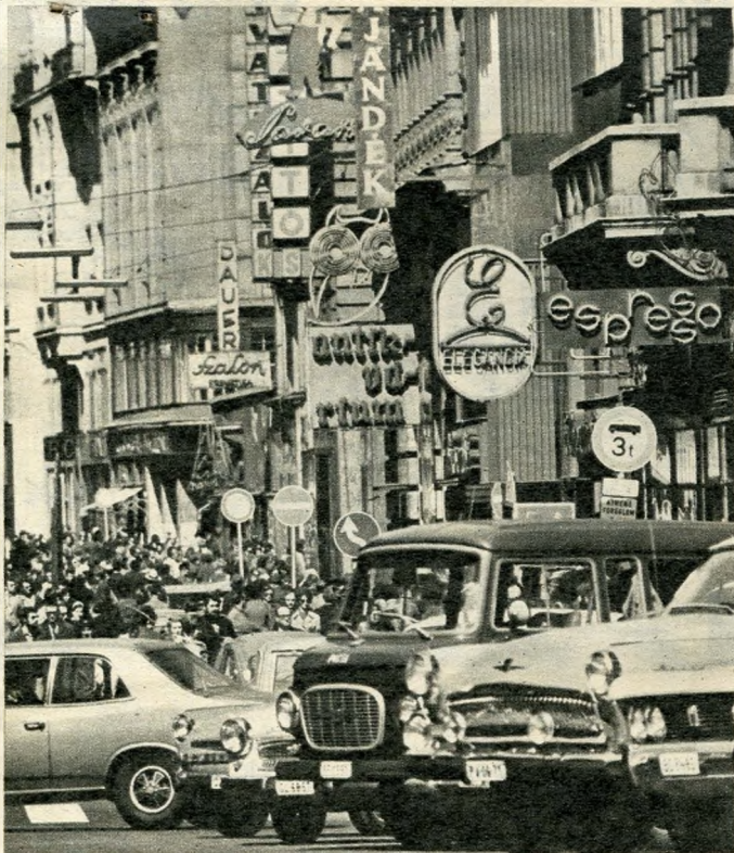
Embersereg, neonerdő, autókaraván a Belvárosban

hogy az ország fővárosa és a magyar kormány székhelye egy erős központot képezzen, a tervezett egyesítés ellen kell nyilatkoznunk. Pest szerencsés fekvésénél fogva mindinkább az ipar és a kereskedelem nyugopontja lón, addig a regényes, de a kereskedés tekintetéből nem a legelőnyösebb fekvésű Buda nagyobb részt szőlők és földművesek lakhelye. Az érdekek ezen ellentéte latba veendő."