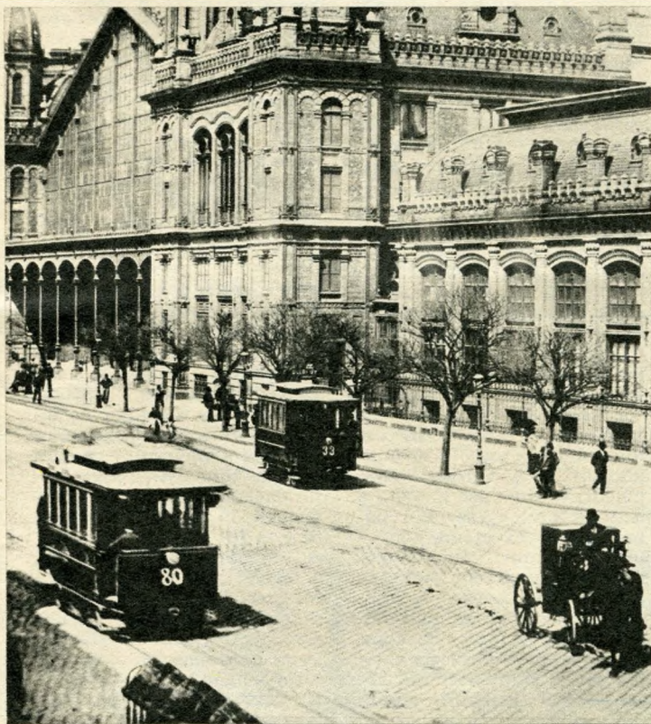
Amikor még csendéletet fotóztak a Nyugati pályaudvar előtt