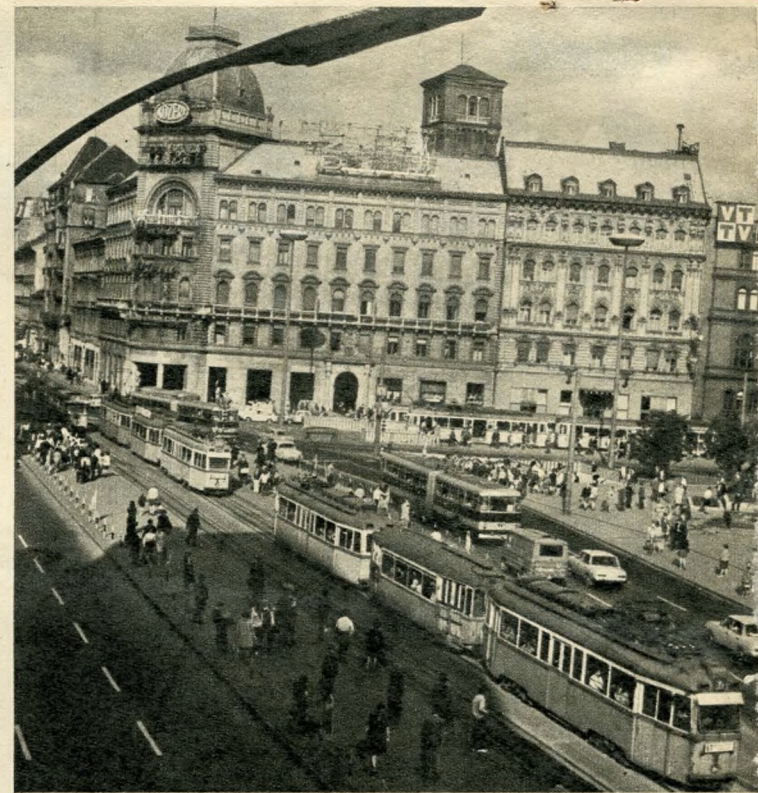
Egy pillantás a hajdani Kerepesi út jelenére

delkezés nem valósulhatott meg; az abszolutista kormányzat félt a függetlenségi eszméket hordozó Pest-től, s csupán Buda és Óbuda közigazgatási egységét erősítette meg. Az egységes főváros csak akkor kerülhetett napirendre, amikor a kiegyezést előkészítő uralkodó osztályoknak reprezentatív központra volt szükségük az állami önállóság fitogtatására, a függetlenség felé tett engedmények elkendőzésére.