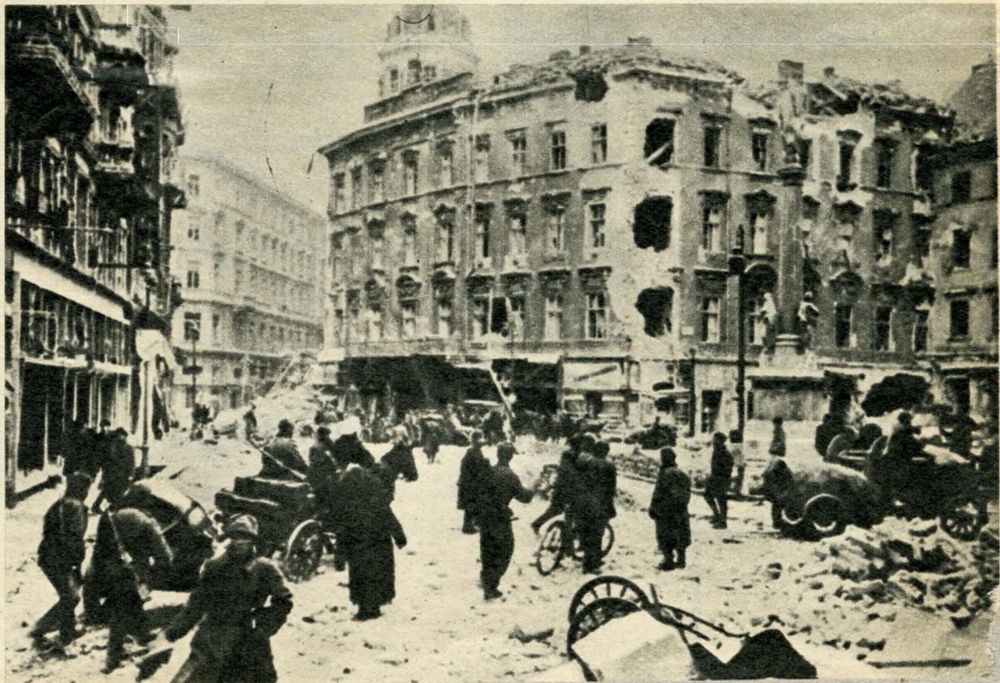
1945 februárja a mai Martinelli téren