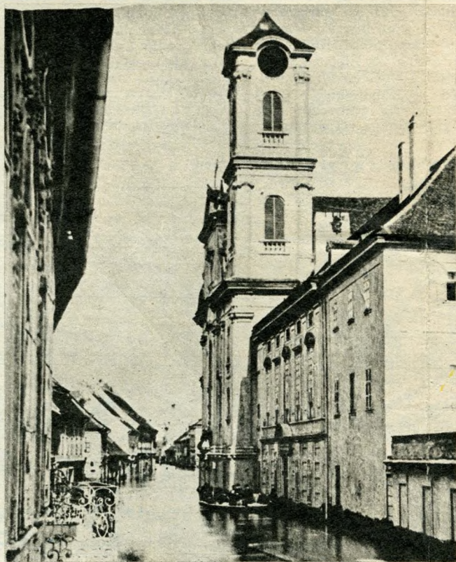
Száz éve készült fotó az árvízlepte budai Fő utcáról