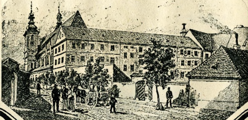
Kétszáz évvel ezelőtt ebben a nagyszombati épületben kezdte meg működését az egyetem orvosi fakultása