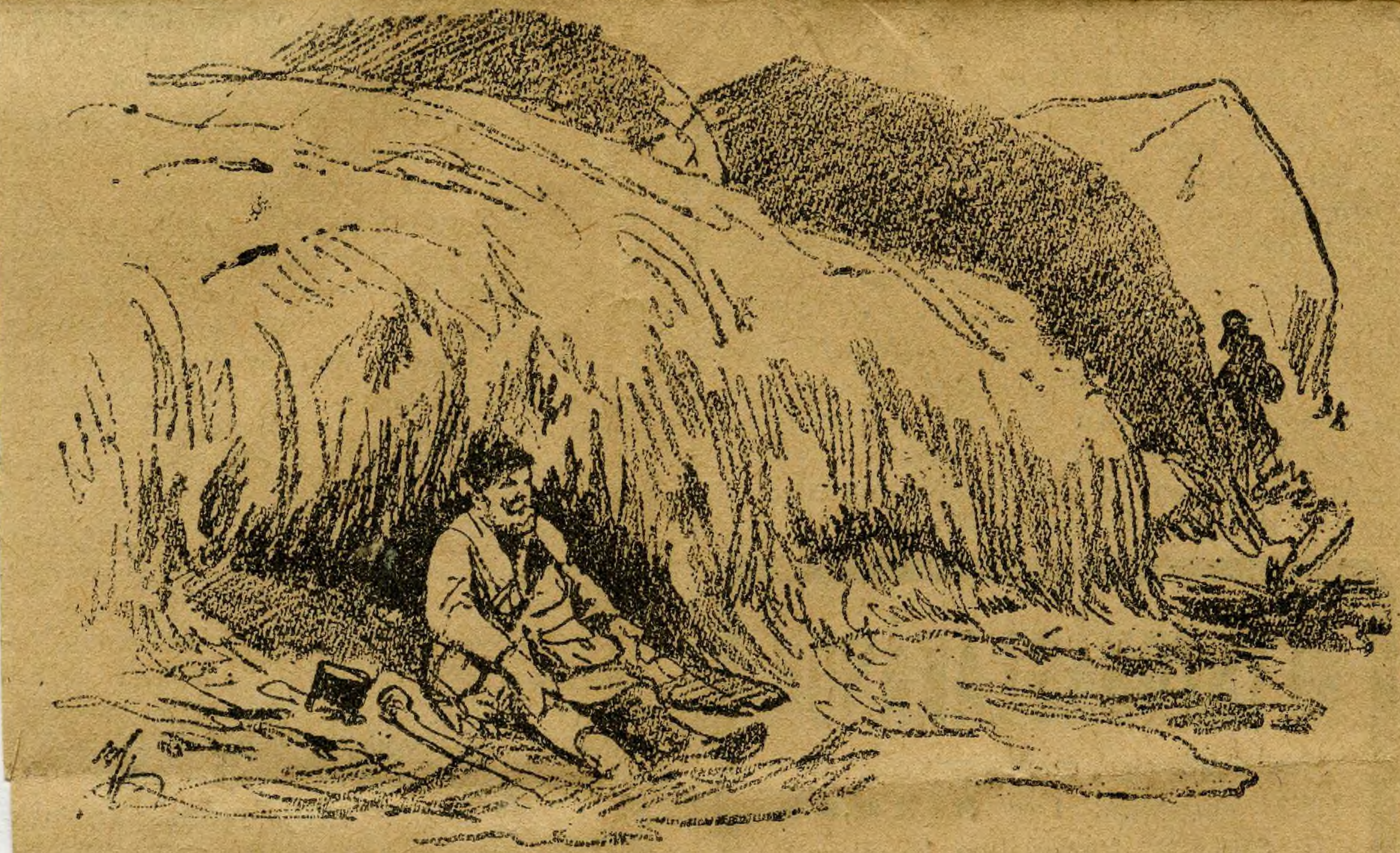
A szalmakazal-népszálló egyik lakója.

— Ez az ucca bizony sáros. Ebbe rózsám a komiszáros. — Jó kedve van, öreg!