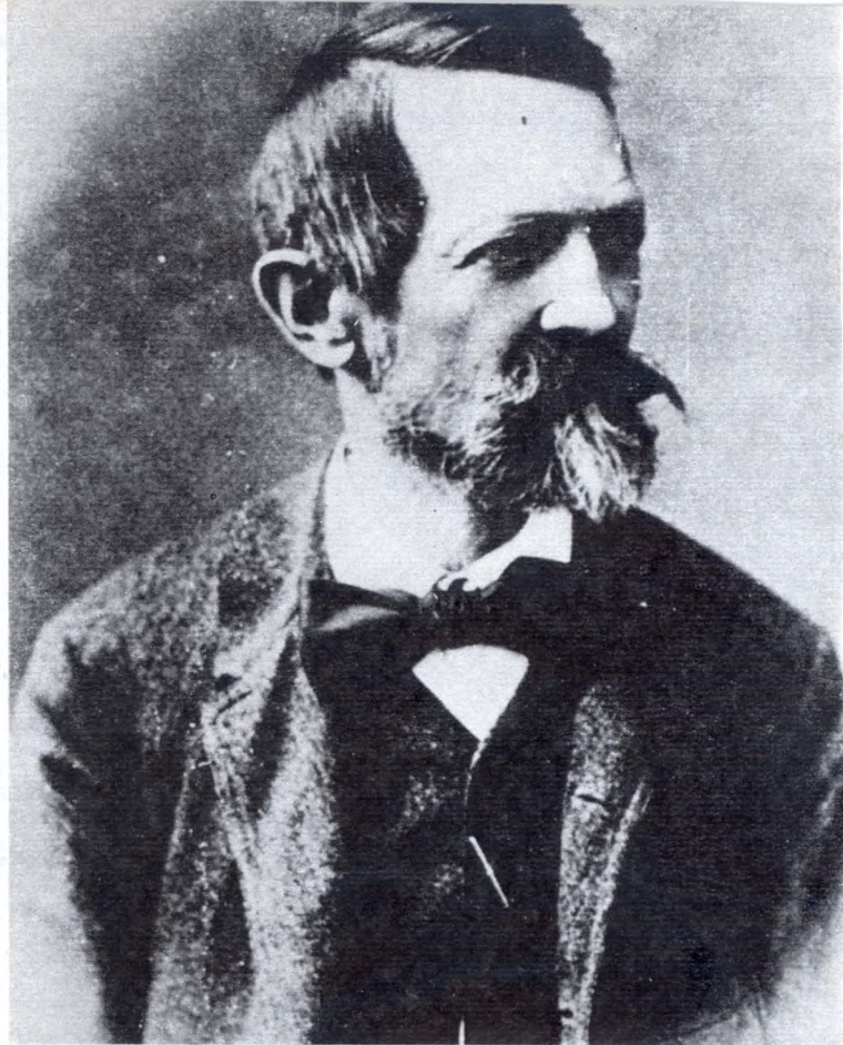
Szinyei József (1830—1913) fénykép

A könyvtár mai munkáját két problémakör befolyásolja különösen: egyrészt a megfelelő szakirányú személyzet utánpótlása, másrészt a helyhiány. Bár a munkatársak száma meghaladja az ötszázat — köztük sok