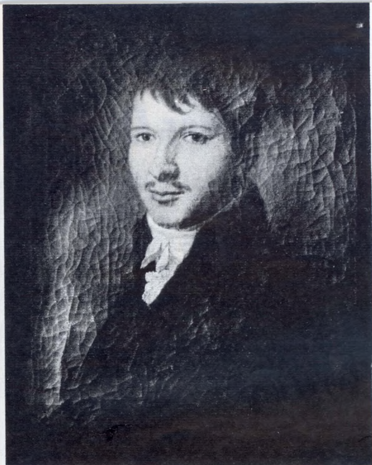
Horvát István (1784—1846) Donát János festménye

Megindul — helynyerés célzatával — a raktártermek modern átépítése. A katalógusok reformját a harmincas évek közepén a szaktudós létére is kiváló gyakorlati érzékű könyvtáros, Fitz József főigazgató készíti elő és hajtja végre. Ő az, aki a nemzeti bibliográfiát, melyet korábban a könyvkiadók szervezete gondozott, a nemzeti könyvtár munkájába építi.