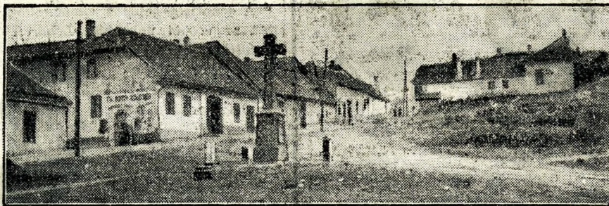
A KERESZT TÉR LEBONTÁSRA VÁRÓ HÁZAI

nyos tótok, ha közben el nem mentek volna egy kicsit Trianonba, zabot hegyezni.