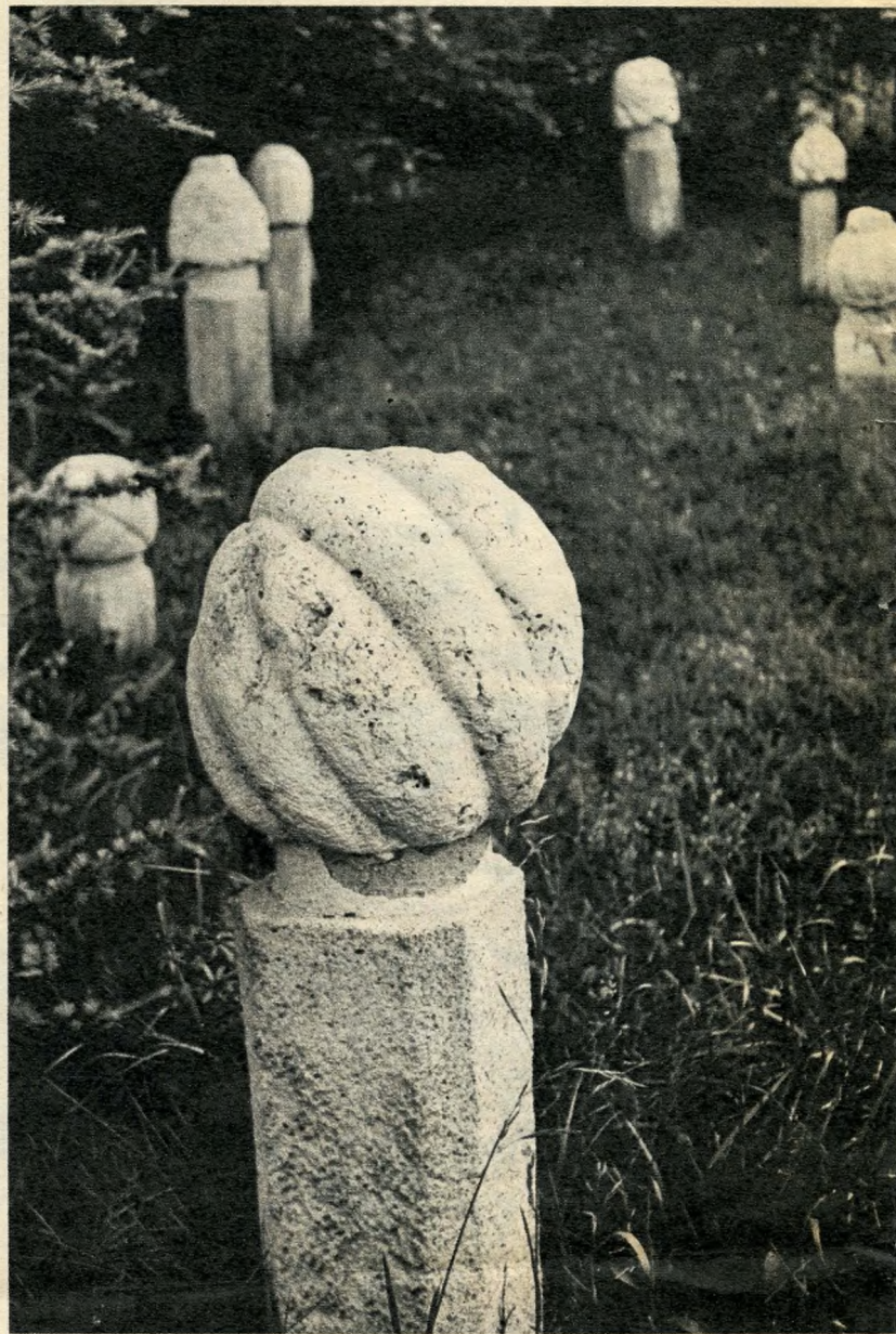
Török temető a budai vár bástyái alatt

csillag járása. Mi később Rácok fürdőjének mondtuk, ma pedig egy régi királyfiról Imre fürdő a neve. S távolabb a harmadik, a Kakaskapu, azaz Horozkapu ilidzséje a Kakas bástya alatt. Ne vedd zokon, de nem szultánról neveztük el, hanem királyról. Mindhárom fürdőtket igen kedveljük, csillagos kupolájuk ma is építőitek dicsőségét hírleli.