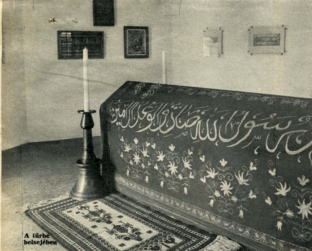
A türbe belsejében

minarékat, medreszéket, türbéket, pasapalotákat, rácsos háremeket, fegyvertárákat és hűvös pincéket. Mennyi mindent építettünk a ti utókorotoknak, mily szépen s okosan.