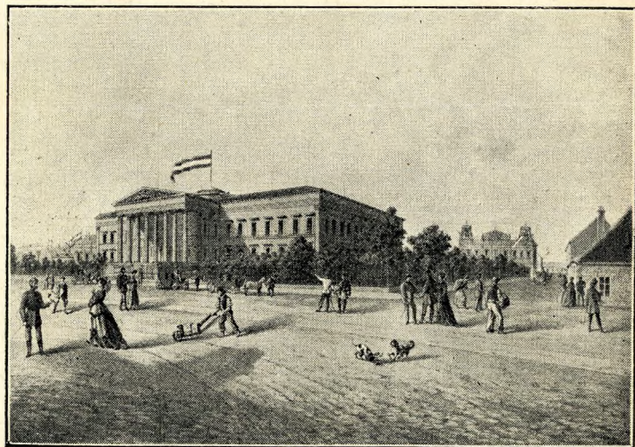
A jubiláló Budapest. A Nemzeti Múzeum. Előtte az Ország-ut. Jobboldalt a Széna-tér (Ma: Kálvin-tér)

Odább a Három Korona-, a Két Sas-utca, meg a Bálvány-utca már kiépült s a nagy kereskedőházak csaknem mind itt alapították meg üzleteiket.