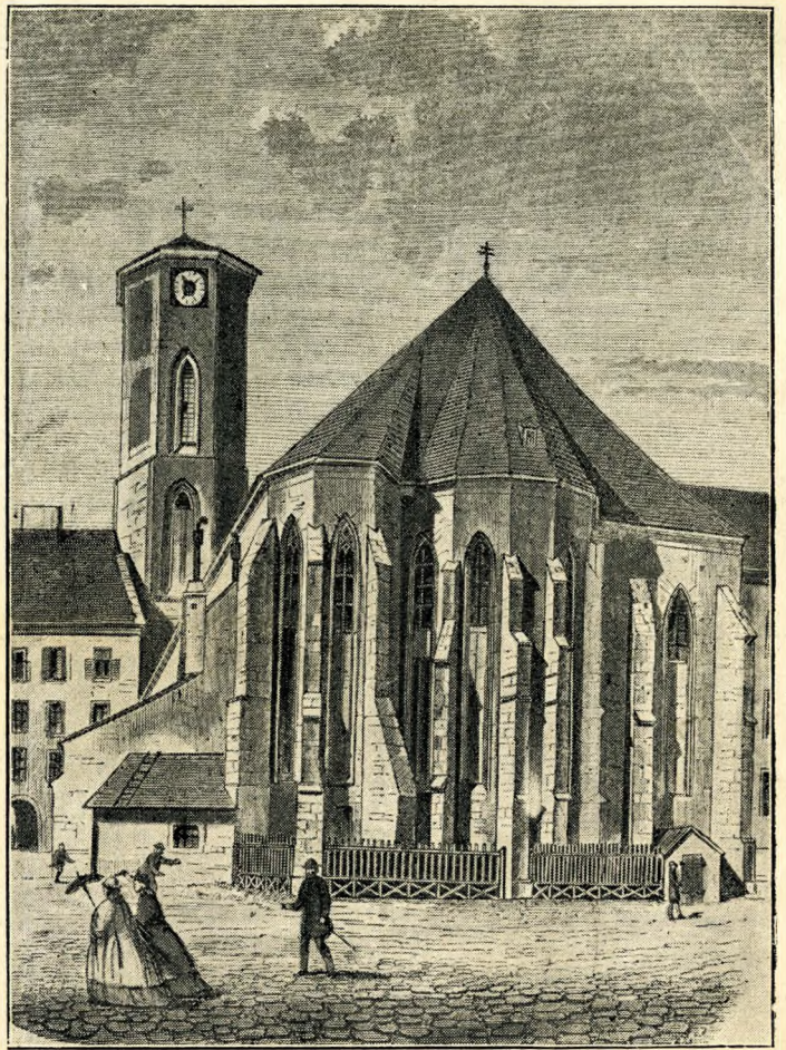
A jubiláló Budapest. Mátyás-temploma 1873-ban. (Myskovski rajza)

Alig hogy a kutyák megugatták — mert akkor