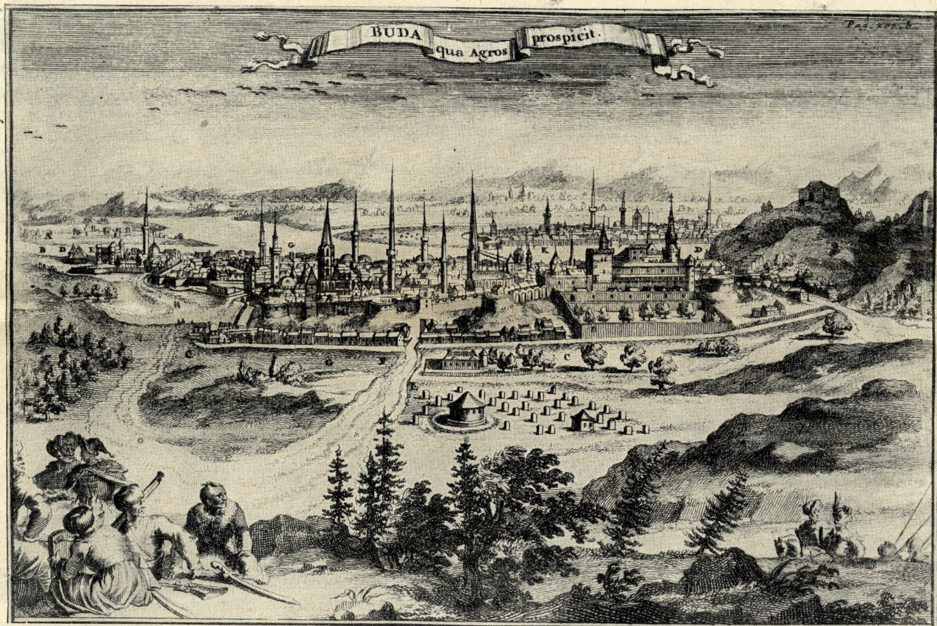
Buda vára a XVI. században. Egykorú metszet Tollius Jakab könyvéből

gatott sírkövein üldögélve, egy-egy apadt szemű, agg egyre gyakoribb tűzvészekkor. Mert ahogy fogyadoz- török: nagy merengve ópiumot szív. Néha még el- tak a kóházak, ugyanúgy szaporodtak az alacsony elvilágít Visegrádig a magyar főváros! De csak az török igényeket teljesen kielégítő, felette gyullékony