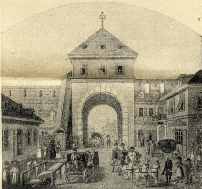
A Hatvani kapu. Warschag akvarellje

Büszke ódon műemlékeket az idegeneknek nemigen mutogathatunk. De Pest-Buda megmenekült. Kedve — vitalitása — mentette meg és tette ilyen nagygyá, nem a segítőhadak.