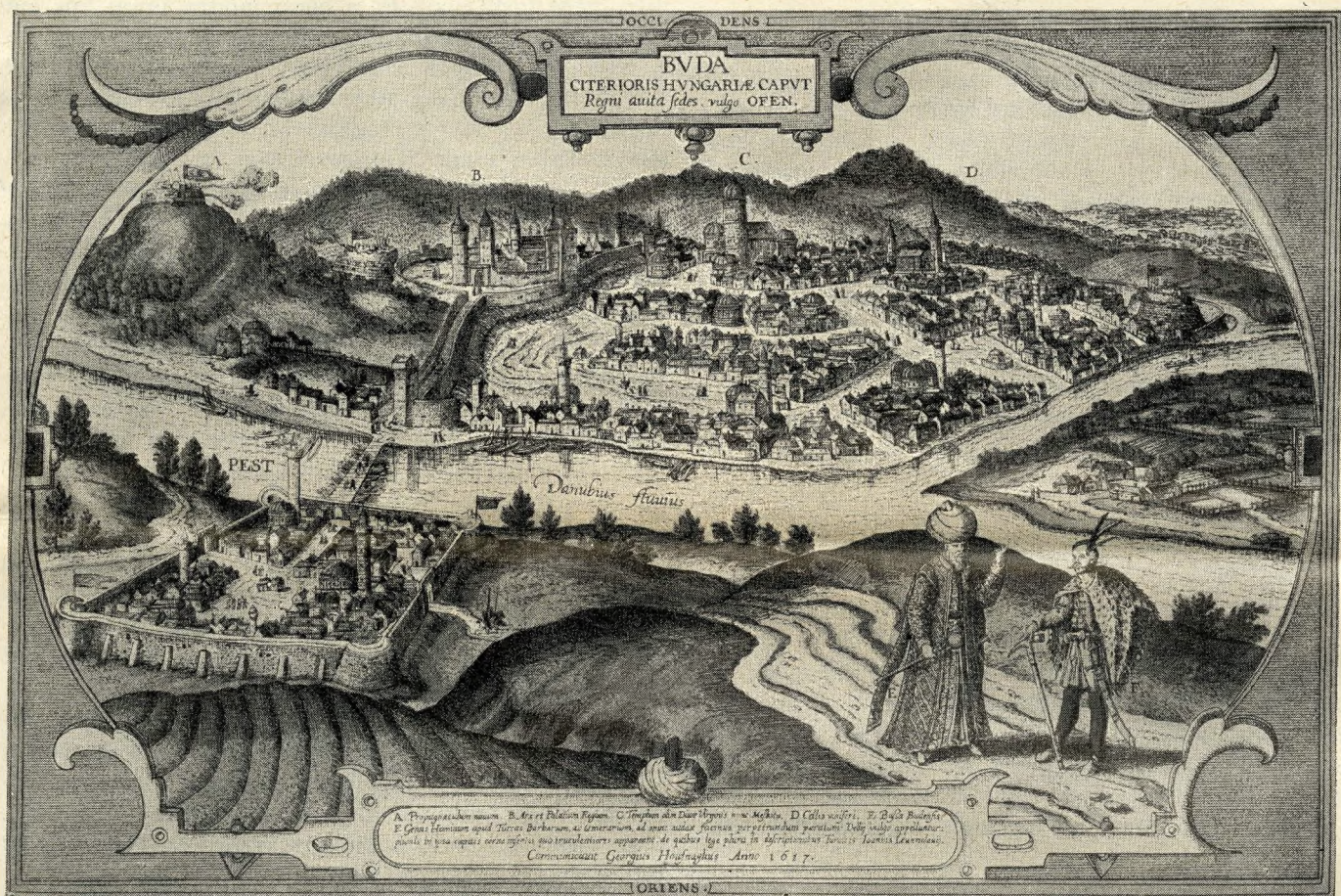
Buda török kézen, a XVII. század elején. Houfnagel metszete

gatott sírkövein üldögélve, egy-egy apadt szemű, agg egyre gyakoribb tűzvészekkor. Mert ahogy fogyadoz- török: nagy merengve ópiumot szív. Néha még el- tak a kóházak, ugyanúgy szaporodtak az alacsony elvilágít Visegrádig a magyar főváros! De csak az török igényeket teljesen kielégítő, felette gyullékony