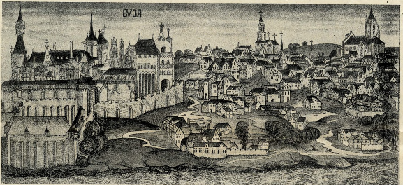
Buda várának legrégebbi ábrázolása. A XV. század közepén készült. Baloldalt Mátyás király palotája

ban van legalább egy, aki a büntetést a többiek fejéről lekönyörgi.