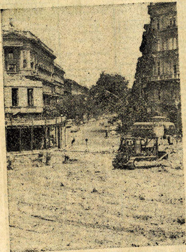
Ma még »csatater«, de augusztus végére a főváros egyik legszebb útvonala lesz az átépített József Attila utca

A fővárosi tanács közlekedési igazgatóságának útépitési osztályán tájékoztatást kértünk a Budapesten folyó nagyszabású útépitési munkálatokról.