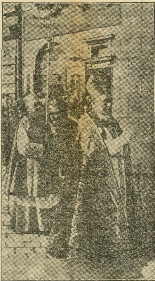
A hercegprimás a koronázási menetben

és nők Mária kongregációja külön-külön, föllendült a sajtó és a népszövetség ügye, melyekről azelőtt alig lehetett szó. Nagy súlyt helyezett az ifjusági kongregációkra. Valahányszor alkalmá nyílt, szívesen avatott föl új tagokat, vagy szentelt zászlót. Személyesen jelent meg a Népszövetségek ünnepélyein,