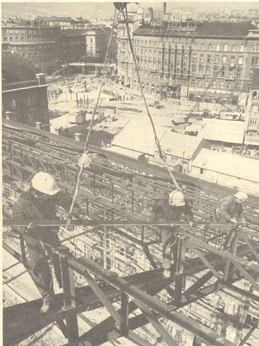
Folyik az építkezés

Az új pályaudvar legmonumentálisabb része a nagycsarnok.