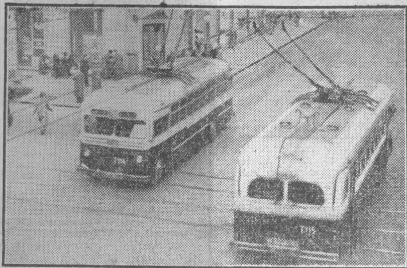
Budapest kedvenceivé lettek a Szovjetuniótól kapott trolibuszok. A trolibusz útvonalát most a Margit-híd pesti hídfőjéig hosszabbítják meg. A felsővezetékét már építik. Idén újabb kocsikkal növekszik trolibuszállományunk.

A 2-es villamos vonalát még ebben az esztendőben meghosszabbítják a Dimitrov-térről a Boráros-térig. A 2-es villamost aluljárón vezeték át a Széchenyi-híd pesti hídfője alatt. Az aluljáróval kapcsolatban az egész Dimitrov-teret átépítik. A villamos aluljáró-