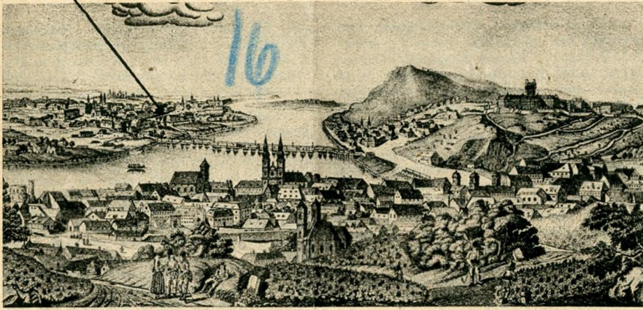
Buda és Pest képe 1790-ben. A nyíllal jelzett helyen van a »Rondella«.