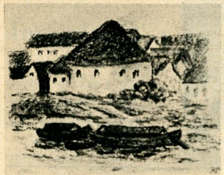
A pesti »Rondella«.