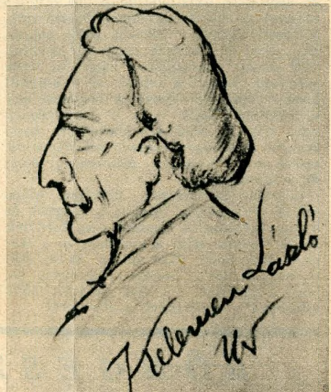
Kelemen László, az első magyar színeszet igazgató.

Kelemen Lászlóék fellépésekor három színház állott a színeszet rendelkezésére. A Várszínházat II. József létesítette a karmeliták kolostorának épületében annak a programnak egyik pontjaként, mely a Budára helyezett császári hivatalok tisztviselőinek igyekezett megfelelő szórakozási alkalmakról gondoskodni. A másik színház Pesten volt, egy használaton kívül helyezett dunaparti bástyatoronyban a »Rondella«-ban, a mai Carlton-szálló terraszának helyén, a Régi posta-utca torkolatában, a harmadik pedig egy fából összetakolt nyári