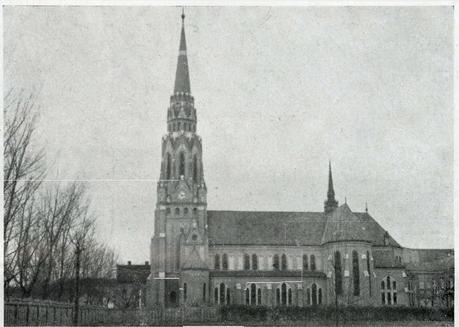
Magdolnavárosi Szent László (Béketeri) plébánia templom

A krisztinavárosi plébánia-templom empire-stílusú templom, bár ennek a stílusnak inkább csak belső elrendezésében hódol, mert külső díszítés rokkó ízű.