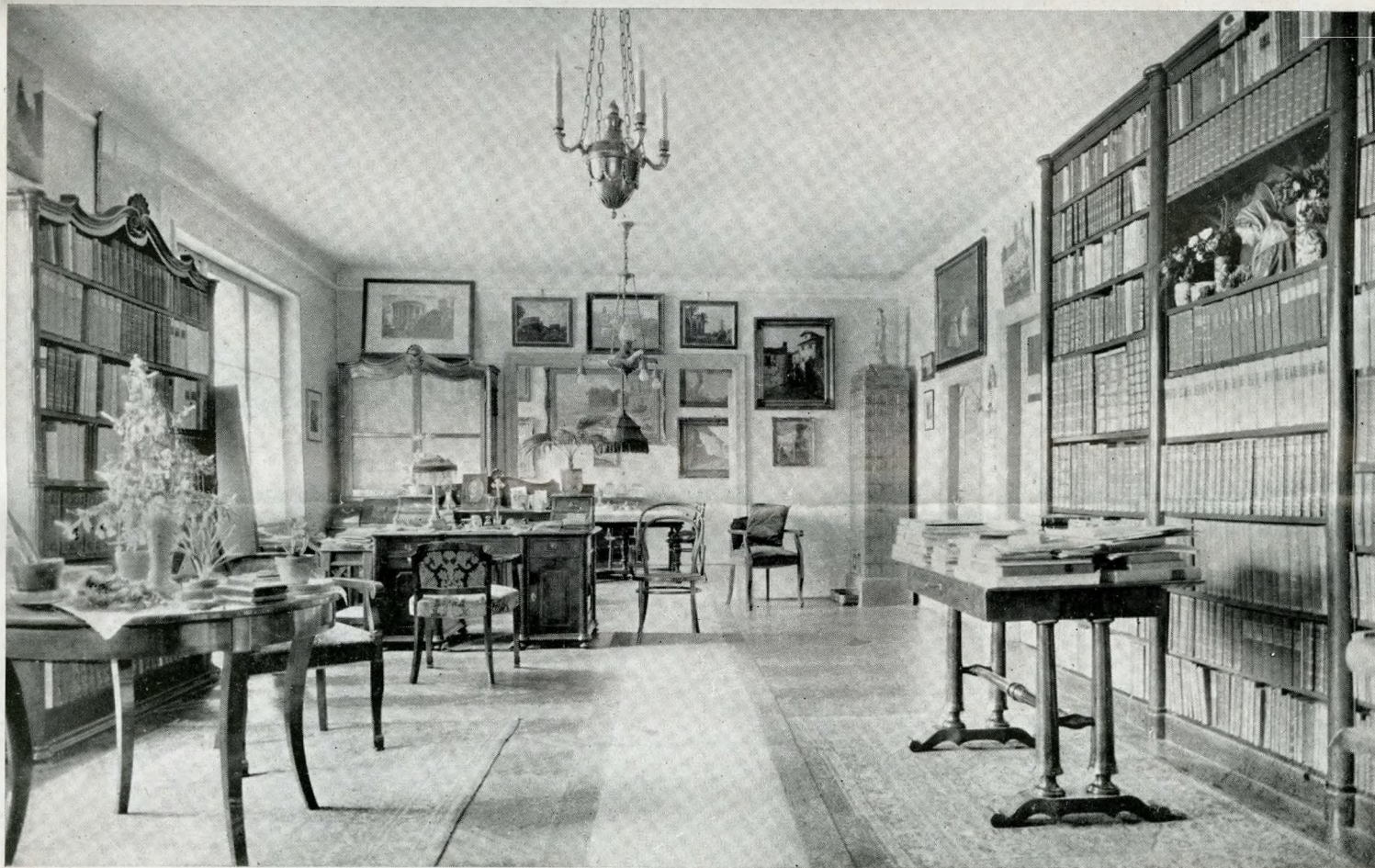
Magna Hungarorum Domina plébánia: Dolgozószoba.