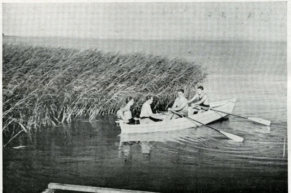
Pesti Szent Imre csónak kikötője Ábrahámhegyen,