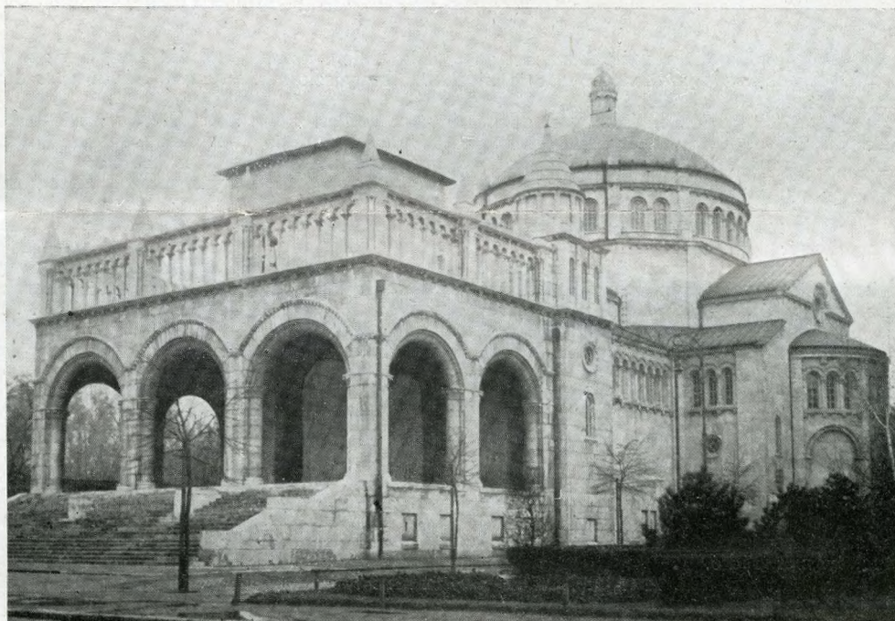
Magna Hungarorum Domina Plébánia Templom.