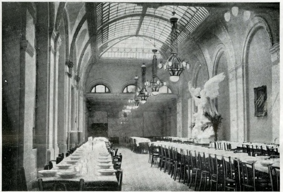
Pesti Szent Imre ebédlő.