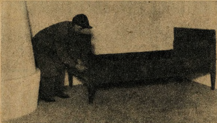
Osszeállítják az ágyat, amelyben a költő született

Még a Bajza-utcai épületet sem az állam adta Petőfinek. Feszty Árpád, a Kőrkep híres festője ajánlotta fel házáat és apósa: Jókai Mór lett az első