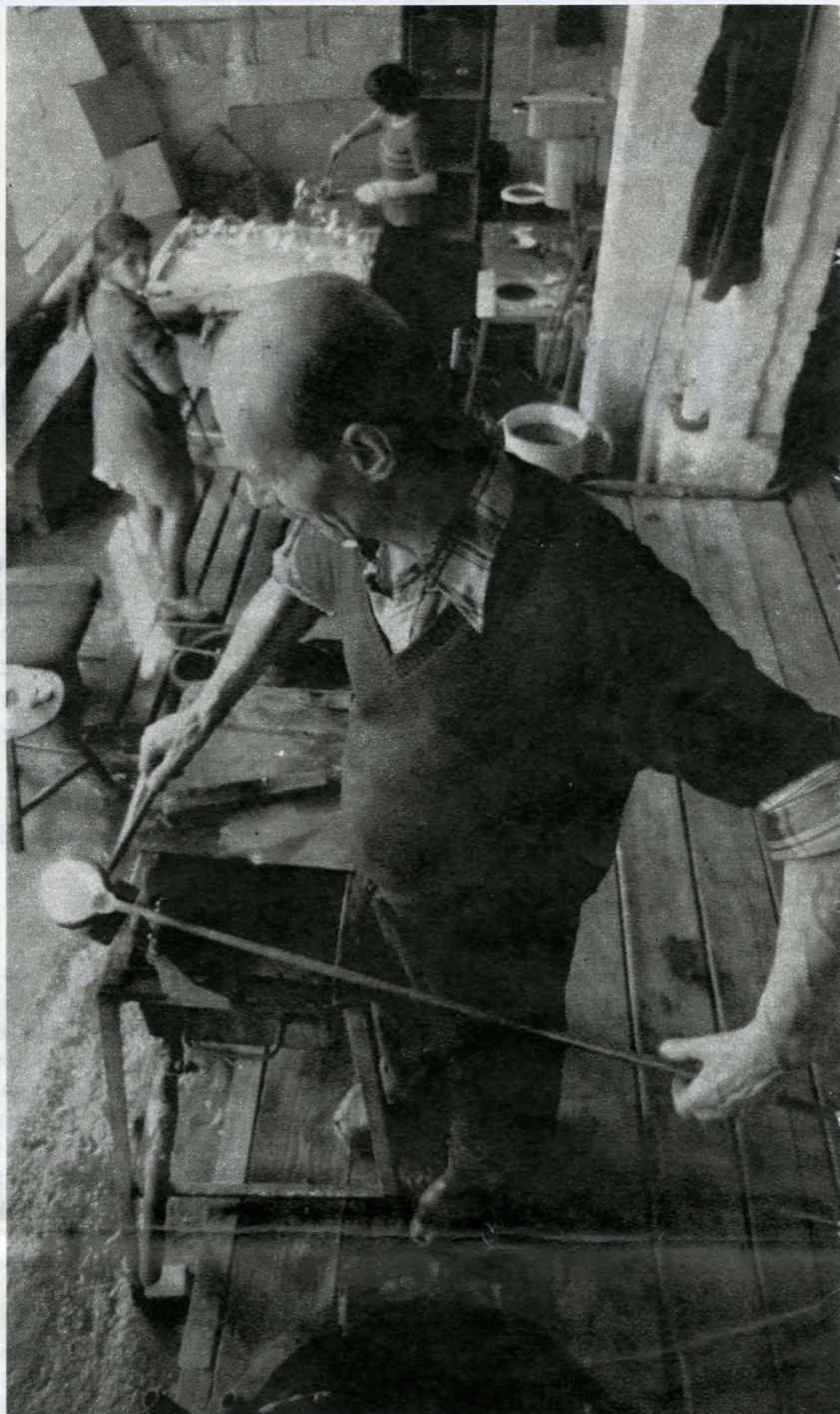
Vigyázni kell, hogy minél kisebb legyen a nőbli

— Most hárman vagyunk egy műhelyben: a lyukmester, az elsősegéd, meg a bankáros — ahogy a bankázót, bankafúvót vagy golyófúvót hívjuk. A mi műhelyünkben én vagyok a lyukmester, egyelőre. De ennek sincs jelentősége, gyakorlatilag egyformán kell tudni az első segéddel mindent. Hogy mégis én lettem, az úgy adódott, hogy egy esztendeje én sűrögtem-forgotam a legtöbbit a kemence átépítésénél. Minden kemencének van egy kifutási ideje, három vagy négy év, mikor hogy. Erre állítólag azt mondták, hogy hat évig is elmegegyfolytában. Ha aztán kiég, kikopik a fenéke,