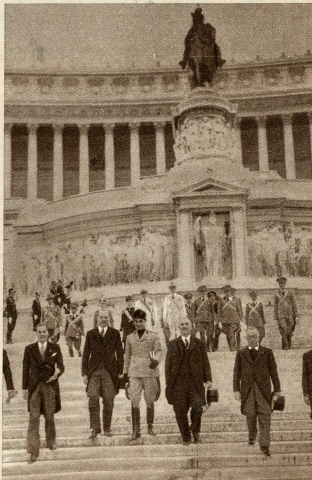
Schmitz dr., Bécs város polgármestere megkoszoruzza Rómában a hősök emlékművét