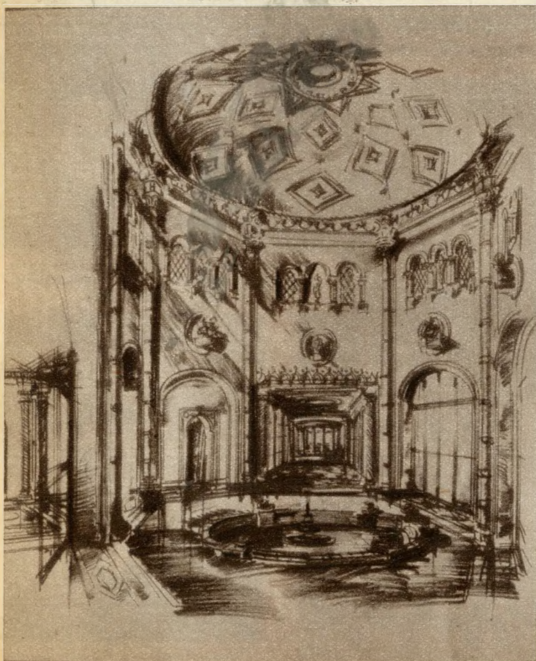
A Rudasfürdő központi helyiségét ábrázoló vázlat

Az eddigi tervektől eltérően az új megoldás a Gellérthegy oldalába helyezi a szállodát úgy, hogy ezáltal az egész alsó terület, amelyet hatalmas árkádsor vesz körül, a fürdőépületek rendelkezésére áll