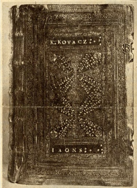
Károli Gáspár Új Testamentumának kolozsvári kötése 1661-ből.