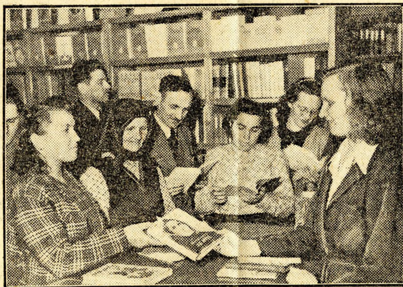
A könyvtárosok sem panaszkodhatnak. Az angyalföldi dolgozók megszerették az olvasást