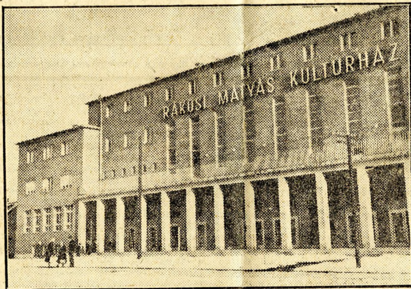
Az angyalföldi dolgozók új büszkesége: a Rákosi Mátyás Kultúrház.

(Még csak annyit szeretnék mindehhez hozzátenni, hogy két óra hosszas látogatás, ismerkedés után mi is felveteli lapot kértünk.)