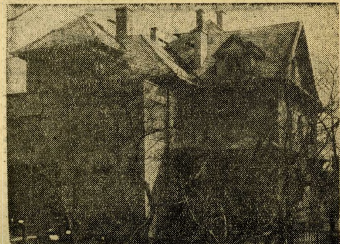
A napközi otthon

Ezeknek az igényeknek csak úgy tudtunk az elmúlt 15 év