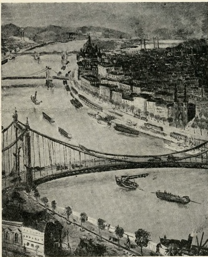
Budapest, peinture par Ladislav Medgyès.

Brückner triomphe à Budapest avec Élisabeth d'Angleterre comme il triomphe à Paris avec le