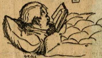
...így olvasott a paplan alatt

— Bizsereg a szívem az örömtől, ha arra gondolok, hogy mindaz