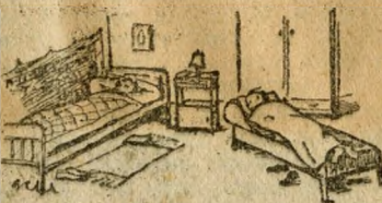
...ott maradtam öt hónapig

— Rengedelgettem tanulmányoztam a sziget történelmét. Két érdekes könyvet találtam, az egyiket Törs Kálmán írta hetven évvel ezelőtt, a másikat egy győri bencés. Mint