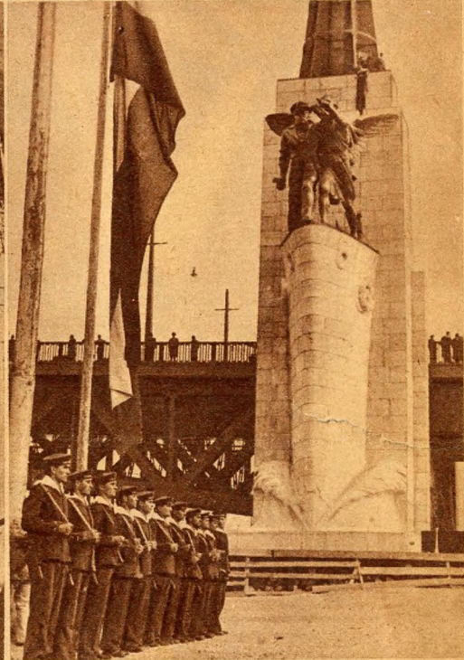
A „Viribus Unitis“ egykori parancsnoki lobogója a tengerész-emlékmű előtti árbocon