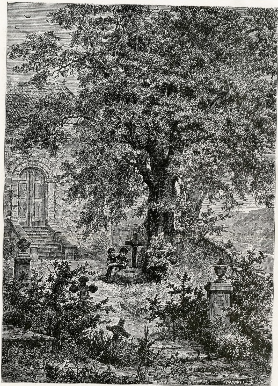
AZ ÁRVÁK MORELLI GUSZTÁV FAMEZSZETE