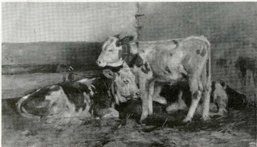
BORJAK EDVI ILLÉS ALADÁR VÍZFESTMÉNYE AZ ÁLLAMI 1000 KORONÁS DÍJ NYERTESE

— Egy másik, épp ennyire dús, maga a művészet, ennek egy speciálisan grafikus ága, a hosszú historiára visszatekintő fametszés. Morelli, a tanár-ember mellé harmonikusan illik oda Morelli, a műhelyben dolgozó művész. Itt is ugyanazon tulajdonságai bontakoztak elő, amelyek professzorságát, egész életét jellemzik. Azt lehetne mondani, egy élet sűrűsödik ezekben a jellemvonásokban. Amit a métier, a fametsző mesterség megkövetel: sok türelem, végtelen lelkiismeretesség és pontosság, aprólékosságokra ügyelő gond, ez nála természeténél fogva adódott, vagy lehet, hogy épp a fametszőkéssel való bánásból, mesterségének materiális részéből következett. Ez kellett, hogy fametszővé lehessen, viszont ezek a tulajdonságok vitték előre mesterségének lépcsőin, ily módon győzte le a technikai nehézségeket, oly könnyűséggel, amire ma nem igen akad sűrű példa. Igaz, hogy ma mindinkább megritkult a fametszők valamikor igen népes sora, minden lépéssel, ahogy tökéletesültek ez új fotokémiai eljárások, a fametszés, mint szorosan vett reprodukáló technika, folyvást hátrább