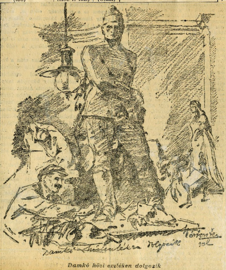
Damkó hősi emléken dolgozik

— Azóta kevesebbet foglalkozom a kispasztikával. Csináltam jó néhány-száz areképet, siremléket, emlékművet