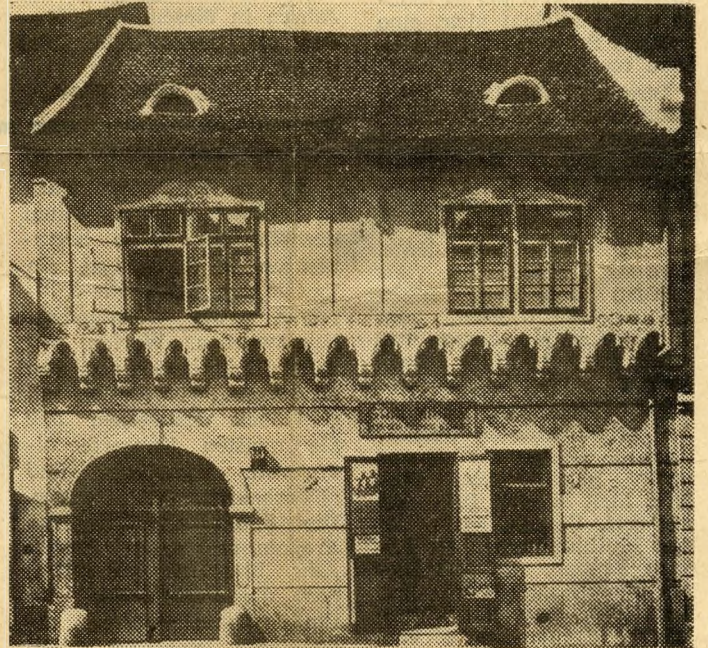
Ein gotisches Gebäude mit rätselhafter Geschichte

westlichen Teil des Hofflügels wurde ein Keller mit türkischem Daubengewölbe aus dem 17. Jahrhundert entdeckt. Die Seitenmauern stammen aus dem 14. Jahrhundert, darin sind Steinkonsolen mit Kopfsteinen in Viertelkreis-Form zu sehen, die ursprünglich wahrschein-