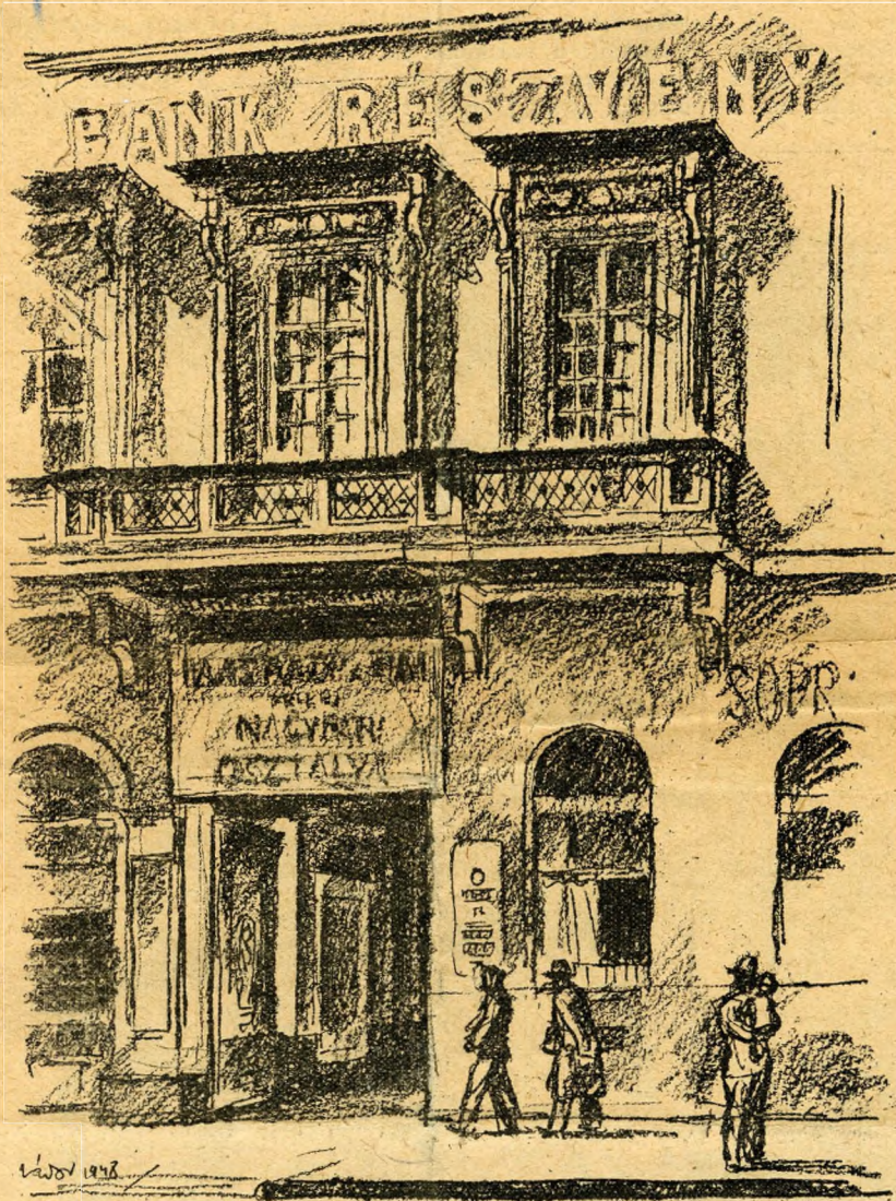
Nádor-u. 18. Az erkélyről Kossuth Lajos beszélt

lazott, de a körvonalaiiban még föl- ismerhető Szép-utcai kapuja előtt állt. Amikor Csengery vette át a lap szerkesztését, akkor Petőfi járt föl a redakcióba, hogy a külföldi lapo- kat és folyóiratokat átlapozza. Csengerynél volt egy nap látogatón- ban Czákó Zsigmond, egykor híres drámaíró, ki kedélyes beszélgetés köz- ben, egyszerre csak pisztolyt hú- zott elő és agyonlőtte magát. Erről a gyászos esetről szól Petőfinék Czákó Zsigmond halálára írt verse. 1848 má- rcius 15-én éri meg ez a ház a maga nagy napját, amikor a márciusi if- jak Heckenast és Landerer nyomdá- jában (a mai magkereskedés helyi- ségében) kinyomatták a cenzura men- tes sajtó első termékeit: a Talpra Magyar-t és a Tizenkét Pont-ot . In- nét beszélt 1848 áprilisában az első magyar felelős minisztérium három vezérfia: Kossuth, Battyány és Deák. Mire eltelik tizenhárom hónap, a kurucból labanccá lett Jókai béke- párti Esti Lapok -jának szerkesztő-