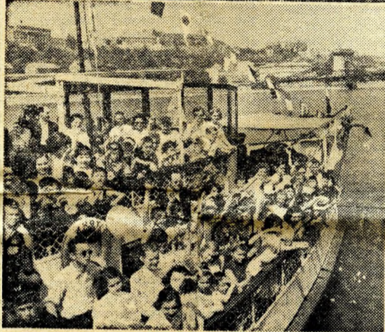
Nyaraló proligyerekek 1919-ben — és 40 év múltán.

munkás, 18,2 százaléka általános iskolai tanuló, 10,7 százaléka tisztviselő, alkalmazott, 11 százaléka háztartásbeli.