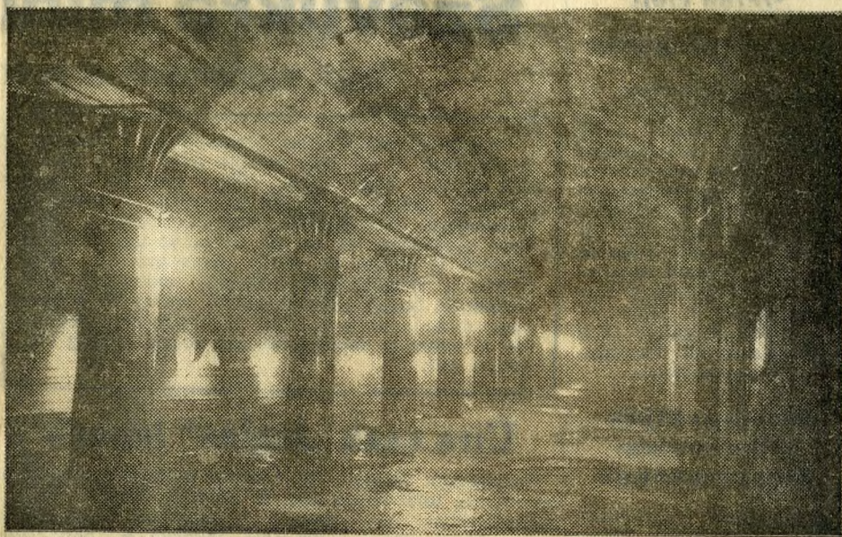
Még csak a vaku fénye világít...