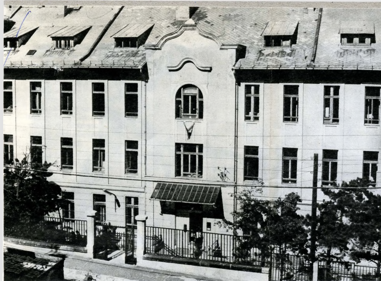
Az Arany János Gimnázium