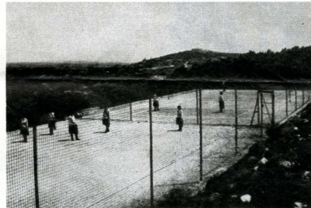
Az egykori tenispályák