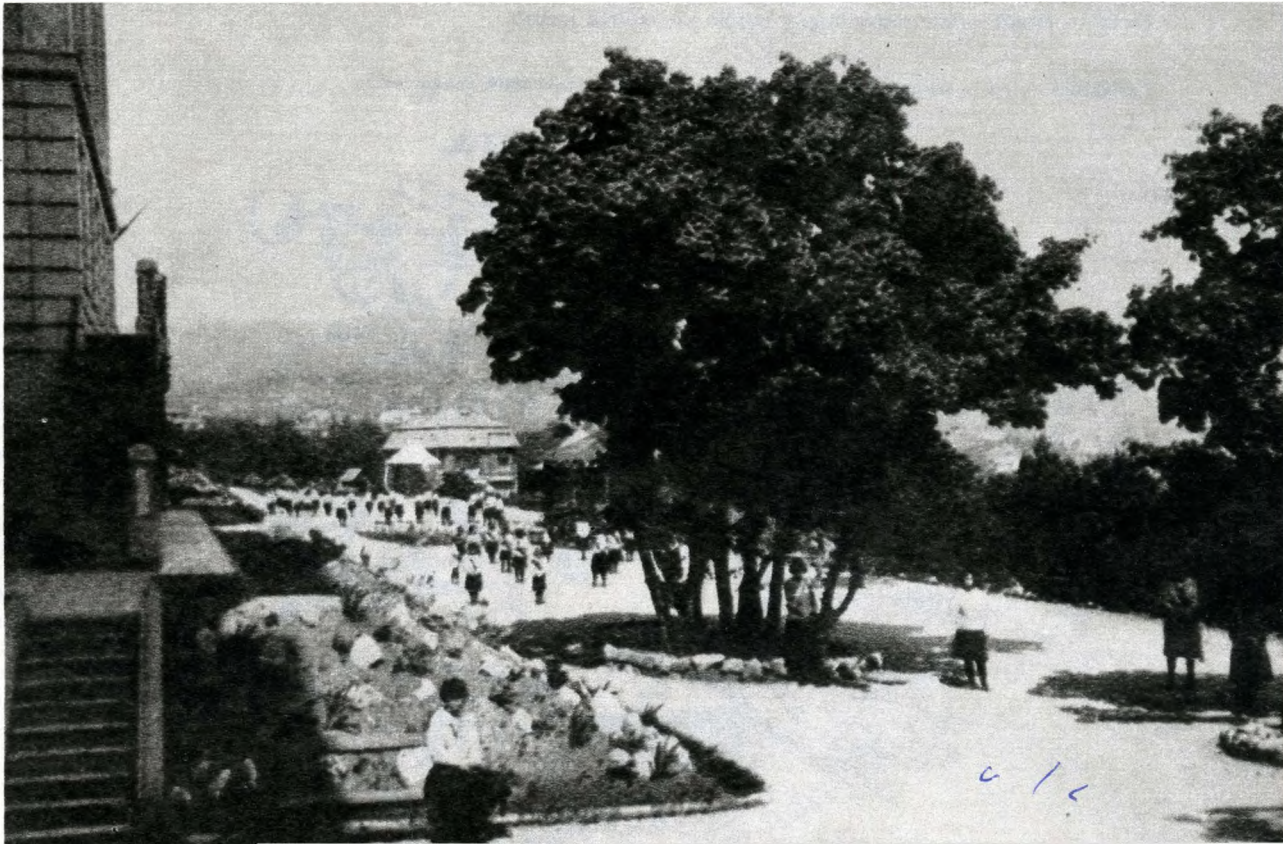
Részlet az intézet melletti parkból