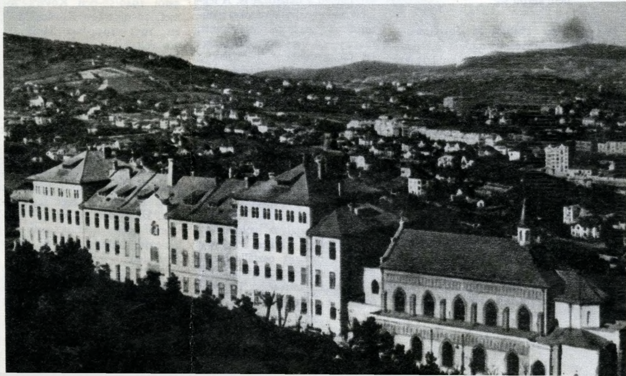
A Notre Dame de Sion épülete. Jobb oldalon a II. világháborúban lebombázott kápolna

A nyilvános tanulók száma az öt osztályban együttvéve 64 fő volt, a magántanulók 14-en voltak. A szülők foglalkozása: földbirtokos 40%, köztisztviselő 18%, magántisztviselő 12%, katonatiszt 7%, tanár 1%, ügyvéd, orvos, mérnök 12%, író 1%, nagyiparos 6%, nagykereskedő 1%, nyugdíjas (nyugalmozott miniszter) 1%, magánzó 1%. Az iskolához neogót stílusban épült kápolna tartozott, amely egyébként az intézet épületéhez hasonlóan építészetileg teljesen jelentéktelen volt. A diákok minden-