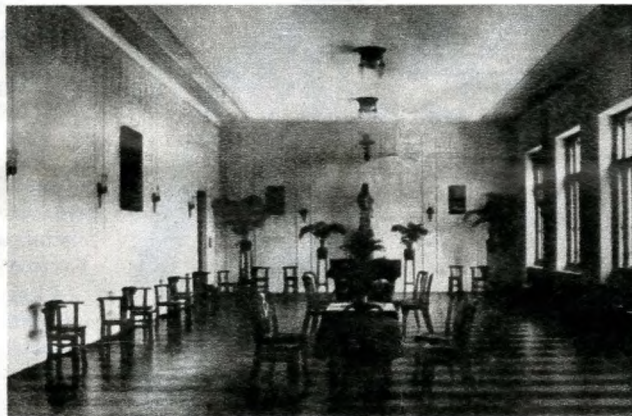
A korábbi díszterem ma tornateremként szolgál