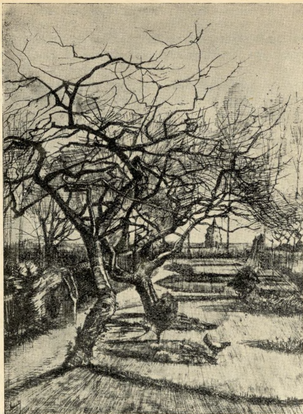
V. van Gogh: Nunneni kert télen

A kiindulás azonban még régebbi. Hoggarth maró, mélyenjáró satírja, Rowlandson nevetésre ingerlő rajza, Gainsborough hangulatos, szentimentális édeskésége képezi a legkorábbi lapokat a gyűjteményben. Majd a klasszicista Ingres exakt rajzával, Bonnington lehetetlenségű vízfestményeivel indul a XIX. század. Delacroix a francia zseni, a romantika nagymestere, akinek a képzőművészetben körülbelül az a szerep jutott, mint Goethenek