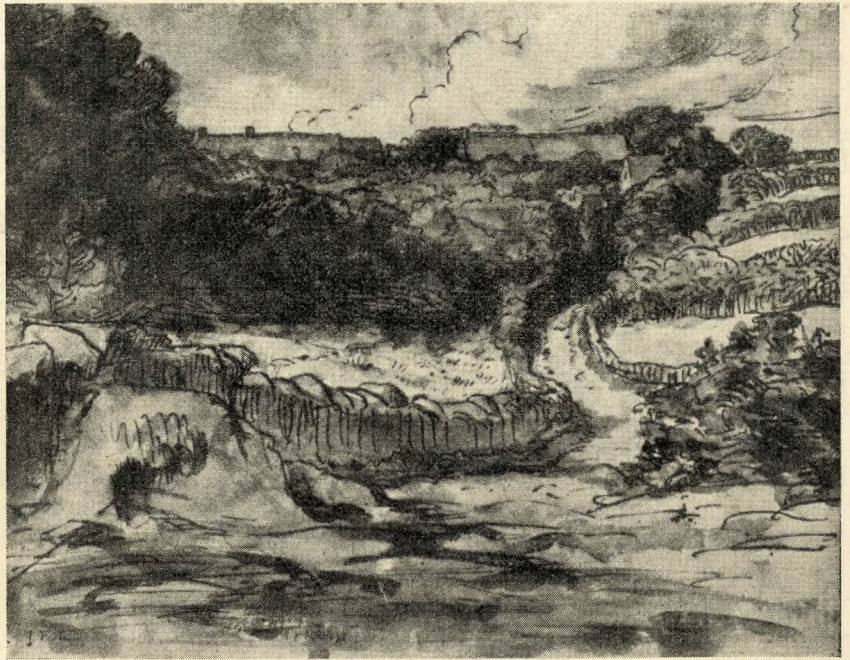
Corot : Tájkép

Faustjával az irodalomban, döbbetesen szép hét vázlattal van képviselve. Villámlástól megrettentarabs paripájának démoni szilüettszerűsége és Szent Sebestyénje örökre felejthetetlen annak, aki csak egyszer is látta. A lányvonalú, érzelmős Millet éppen úgy mélyen emberi rajzaiban, mint nagy munkáiban. Minden egyes ceruzahúzása nagy szellemét sugározza. Courbetnek csak egy szénrajza jutott Majovszkyhoz s bár a nagy realista szakadatlanul körülbelül azt hirdette, hogy az érzés ne tengjen túl a művészetben, mert megárthat az egészségnek, mégis ezen a rajzán erősen szentimentális. Pedig a valóságkereső Courbet megvetette az érzelgősséget és ezért mondotta egy alkalommal gúnyosan, hogy Corot nagyobb festő, mint ő, mert az még azt is megfesti, amit nem is