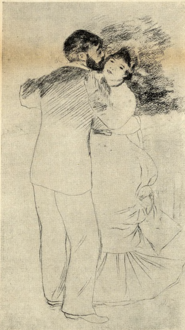
A. Renoir: Valcertáncosok