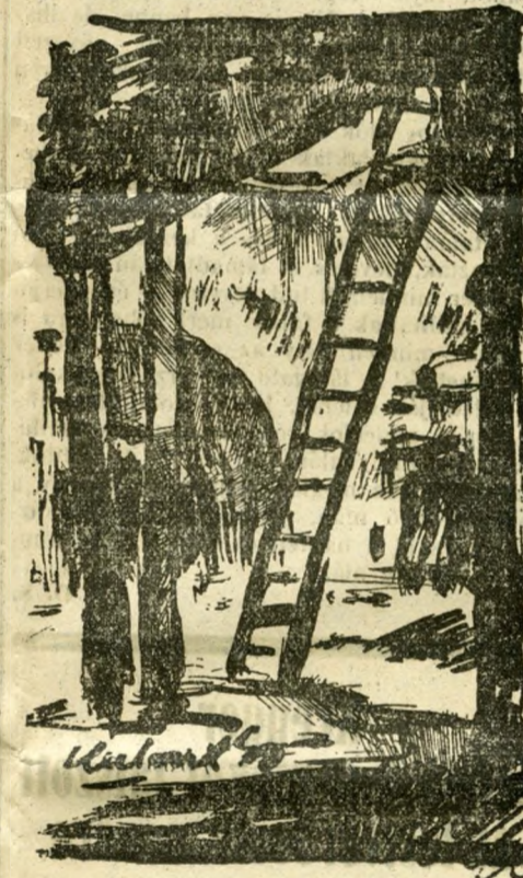
A Szentháromság-szobor alá vivő alagut bejárata

már hason csuszva lehet csak idáig közlekedni s bizony, ahogy visszaérünk a barlangba, hamarosan osonunk is belőle kifelé. A mennyezete homok s ha véletlenül itt lép