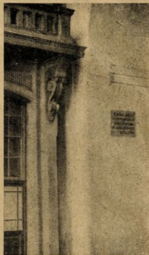
Az Alagut régi táblája

A főváros legrégebb tere a Szarvas-tér, amelyen egykor állítólag Mátyás király vadászkastélya állott. A regubeli szarvas még ott látható a tér két régi házában, míg egy harmadik házon az erkély foglalja le a szemlélő érdeklődését. Az erkélyen t. i. teljesen elrozsdásodott felirat hirdeti ékes német nyelven, hogy ez a ház a nagy budai tüzvéz után épült, amely 1810-ben 600 házat pusztított el. József főherceg állt akkor Buda újjáépítési munkáinak élére és ő építette fel Tabánt újra. („ Rief Taban aus der Asche “... mint a tábla mondja.) Hát az „uj“ Tabán megvan még — egyrészt ugyan már lebontották — de már a többi sem lesz hosszúéletű, amit azok a tervek bizonyítanak, amelyek a városházán a jobb