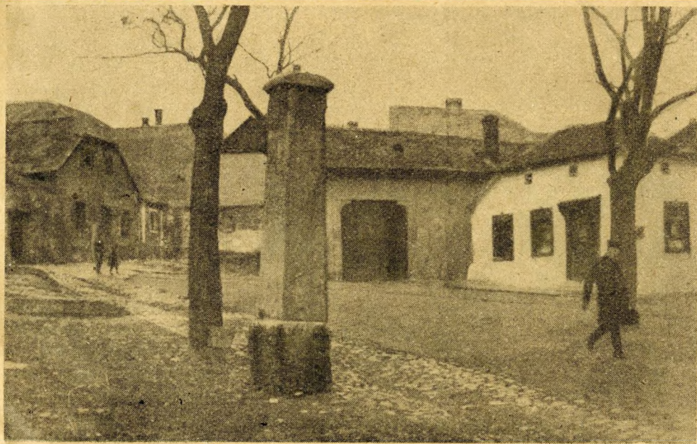
A pellengér a Fehér Sas-téren

Hát nem nagyon sok ostorcsattan el ma már az alagutban. De amikor ezt a táblát odatették, akkor még büszke négyesfogatok robogtak át Budáról Pestre, a strucctollas kocsis, vagy a hetyke gavallér, aki a bakon ült, megesördítette ostorát és repült a négy sárkány, üdvös rémületbe ejtve a jámbor Buda sváb lakóit, akik rettenetes zajnak találták az „ostorcsattanást“. Bezzeg, ha ma hallanák az autótülkölést, a motorkerékpárok borzalmas kattogását, a nehéz autóbuszok robaját, vajon nem kívánnák-e vissza a régi időket és nem lennének-e boldogok, hogy újból hallják az „ostorcsattanást“.