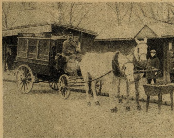
A Krisztina-téri omnibusz

Bizonyára akad még sok ilyen rejtett „ócskasága“ Budapestnek, amelyeket nem merünk régiségeknek nevezni, mert hisz erre az elnevezésre nem méltóak. Régiség: Aquincum vagy a budai Vár egyik-másik része, amelyeknek megvan a történelmi multjuk. A mi sétányunk egy-két furcsa anachronizmusra terjed ki, semmiségek, igénytelen apróságokra. De éppen ezek a kedvesek, mert közvetlenül beszélnek szívközhöz, mint a régi csipkék és fátylak az urihölgy szekrényében. És le kellett őket rögzíteni, mert lehet, hogy holnap már eltűnnek, hadd maradjon valami itt a színükből és illatukból, régmúlt idők kedves emlékéből.