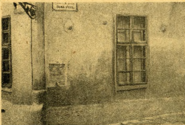
Ágyugolyók a ház falában

Itt van mindjárt ez a két városrész: Rácváros és Tabán. Furesén hangzik már a nevük is, patinája van ennek a két névnek első hallásra is. A Rácvárosban ma már alig-alig találunk szerbeket, s ha akad is, nem nagyobb a számuk, mint a főváros egyéb kerületeiben. A Tabán pedig török szó, magyarul azt jelenti, a hegylába , de nemcsak a neve, maga a Tabán is a török idők emlékét hirdeti. Kezdődik a Rudasfürdő török kupolájával, amelyet Musztafa basa építtetett 1560 körül, s ahogy belépünk ebbe a vá-