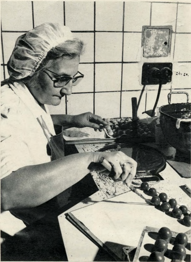
Szeszes meggy kézi mártása