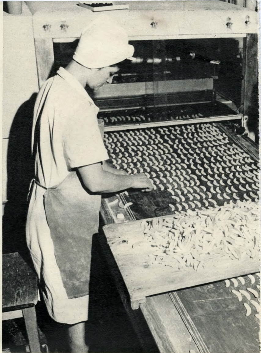
Zseléiv előkészítése csokoládémártásra

is gyártanak, s olyan kitűnő minőségű termékeket hoznak forgalomba, hogy a Dreher-teasütemény hamarosan vetélytársa lesz a kis cukrászdák által kínált áruknak. A teasüteményeket annyira kedvelték, hogy a szezonidőn kívül is folyamatosan gyártják – évenként mintegy 100 tonnát.