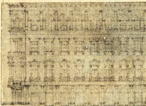
Ilyen lesz a Dorottya-utca 13. számú ház — és hasonlóképp a főváros többi háza — rendezés után.