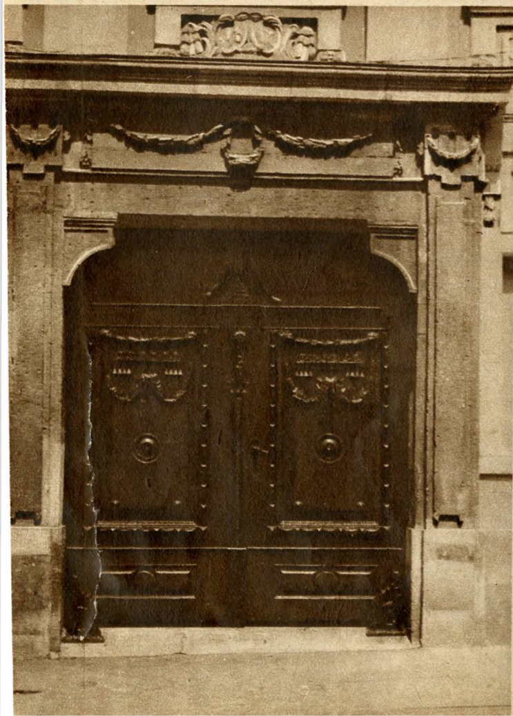
Copf kapu a Várban