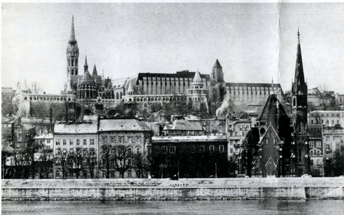
A Mátyás-templom és a Hilton szálló látványa a pesti Duna-partról