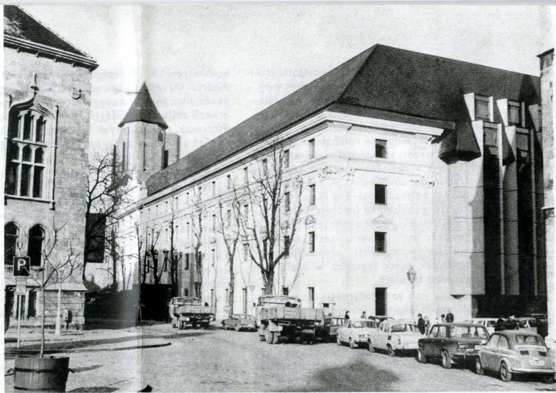
A helyreállított jezsuita kolostor és az új szálló csatlakozása a Szentháromság tér felől (jobboldalt a Mátyás-templom fala)

Az első kérdés, amely válaszra vár: helyes volt-e egyáltalán a Várnegyednek ezen a pontján ilyen hatalmas szállót építeni? Beilleszthető-e az épület tömege a budapes-