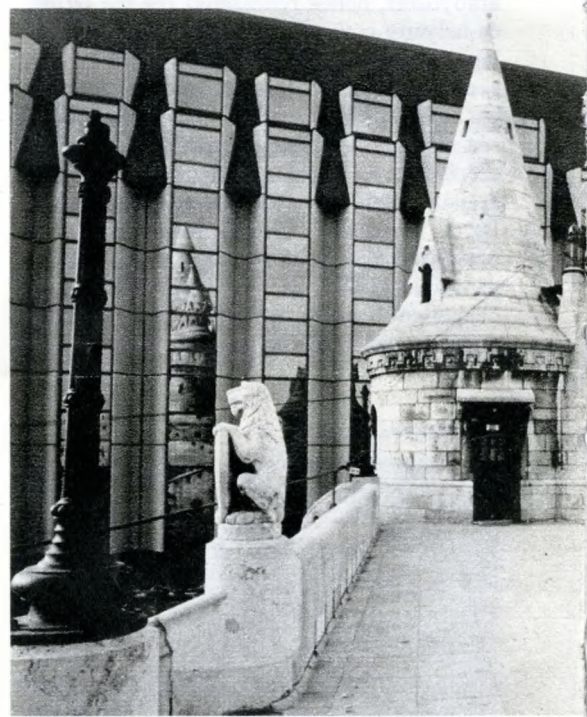
A szálló a Halászbástyáról

Kevés budapesti építkezés állott annyira a közérdeklődés homlokterében, mint a Hilton szállóé. Olvasói levelek százai ostromolták újságjainkat és folyóiratainkat, s a legtöbb véleményből aggodalom csendült ki: nem fogja-e az új hatalmas építkezés tönkretenni Budapest egyik legjellegzetesebb városképét, a budai Várhegy harmonikus sziluetthatását, a történelmi értékű Várnegyed hangulatát?