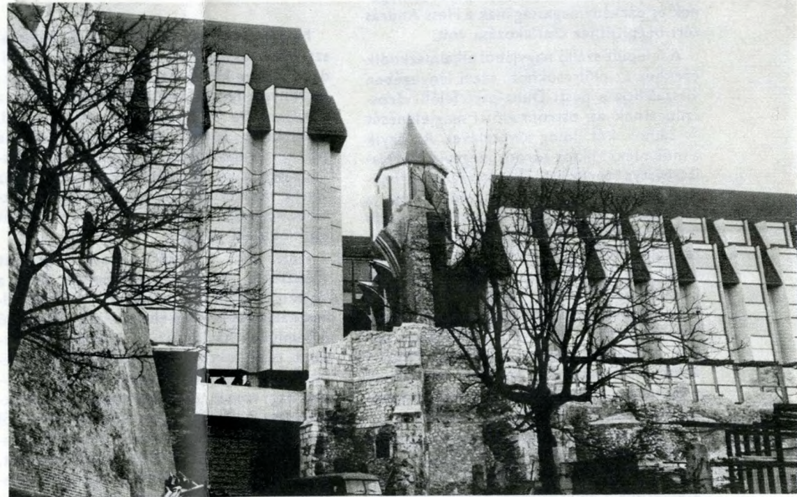
A Hunyadi János út elágazásából látjuk a dominikusok volt templomának maradványait s fölötté az új szállót