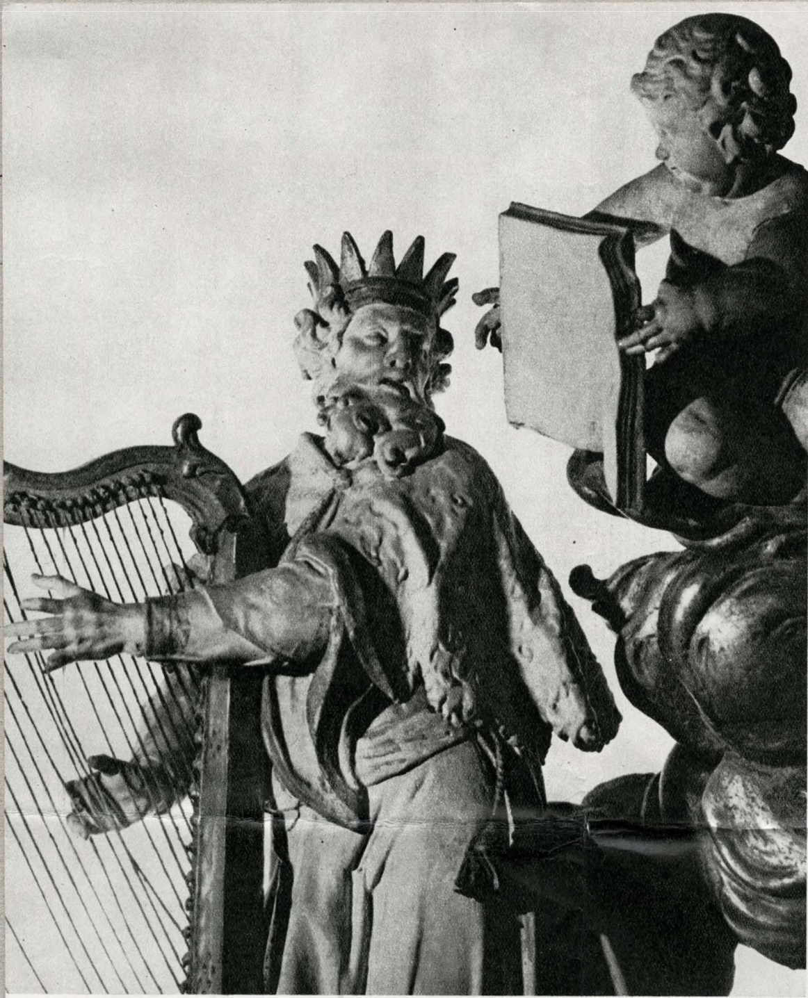
Wéber Lénárd: Dávid király. Festett, aranyozott fa szobor a XVIII. sz. közepéről