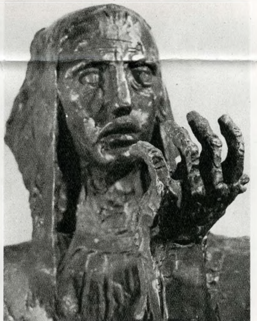
Somogyi József: Éhség