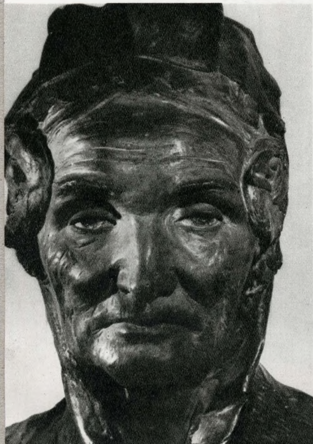
Stróbl Alajos: Anyánk