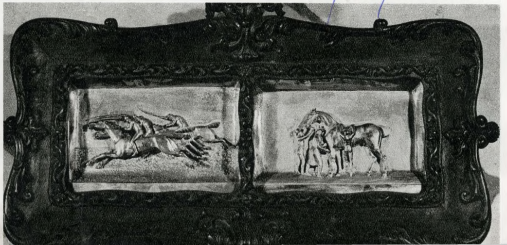
Szentpéteri József: Lóverseny. Ezüst domborműpár a XIX. sz. első feléből