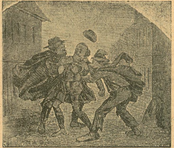
A múzeum kerítése — Közbiztonság a múzeum környékén

mindezt csak a képzelődés csodás szemüvegén lehet meglátni, de mit tesz az, ez nem kerül sok kiadásba.