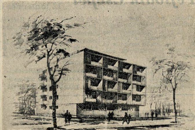
Népköztársaság útja 122.

A Népköztársaság útja 122. szám alatt épülő öröklakásos társasház négyemeletes lesz, felette tetőemeletet is építenek. Tíz kétszobás-étkezőkonyhás és nyolc garzonlakás épül, valamennyi loggiával vagy erkéllyel. Botka Mária , az Iparterv mérnöke tervezte az épületet, amely a jövő év július végén lesz beköltözhető.