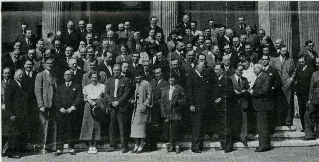
Il gruppo dei giornalisti di diciotto Nazioni convenuti a Budapest per invito dei loro colleghi ungheresi. - Sopra: La lapide con le parole del Duce alla base del monumento alla Grande Ungheria, a Budapest. - In alto: Pittorresca veduta notturna della città. - Qui sotto, a sinistra: Il Danubio e veduta panoramica, e a destra, uno degli stabilimenti di bagni più lussuosi che abbondano nella capitale ungherese e sono frequentatissimi da cittadini e forestieri. I primi bagni erano stati costruiti a Budapest dai legionari romani.

L'Ungheria ha una storia ricca di avvenimenti grandiosi e soprattutto di lotte sanguinose. Il suo popolo è laborioso, fiero e cavalleresco. Budapest, diventata la capitale di uno Stato mutilato dal trattato di pace, ha mantenuto tuttavia il ritmo di vita di una metropoli. Trianon ha strappato all'Ungheria circa due terzi del suo territorio fecondo e ricco di materie prime e milioni di abitanti: la popolazione, da oltre venti milioni, è ridotta soltanto a otto. L'Ungheria, è vero, ha perduto la guerra e in un certo senso doveva pagare almeno in parte gli errori dei suoi alleati, ma è anche vero che fra le Potenze centrali è quella che non ha avuto nessuna responsabilità nello scoppio della conflagrazione mondiale. Essa ora soffre, con dignità e fierezza, della mutilazione subita, e della situazione creata per la quale gli Stati,