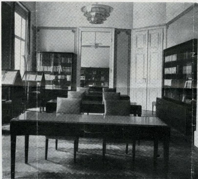
La sala di lettura e la sala di esposizione del libro italiano nell'Istituto Italiano di Cultura di Budapest. - In alto: Veduta del magnifico Castello Reale col parco lussureggiante che lo circonda. - Qui sotto: Pregevole pittura che riproduce il Bagno all'Isola di Santa Margherita che è circondata dalle acque del Danubio, e ricca di sorgenti termali.