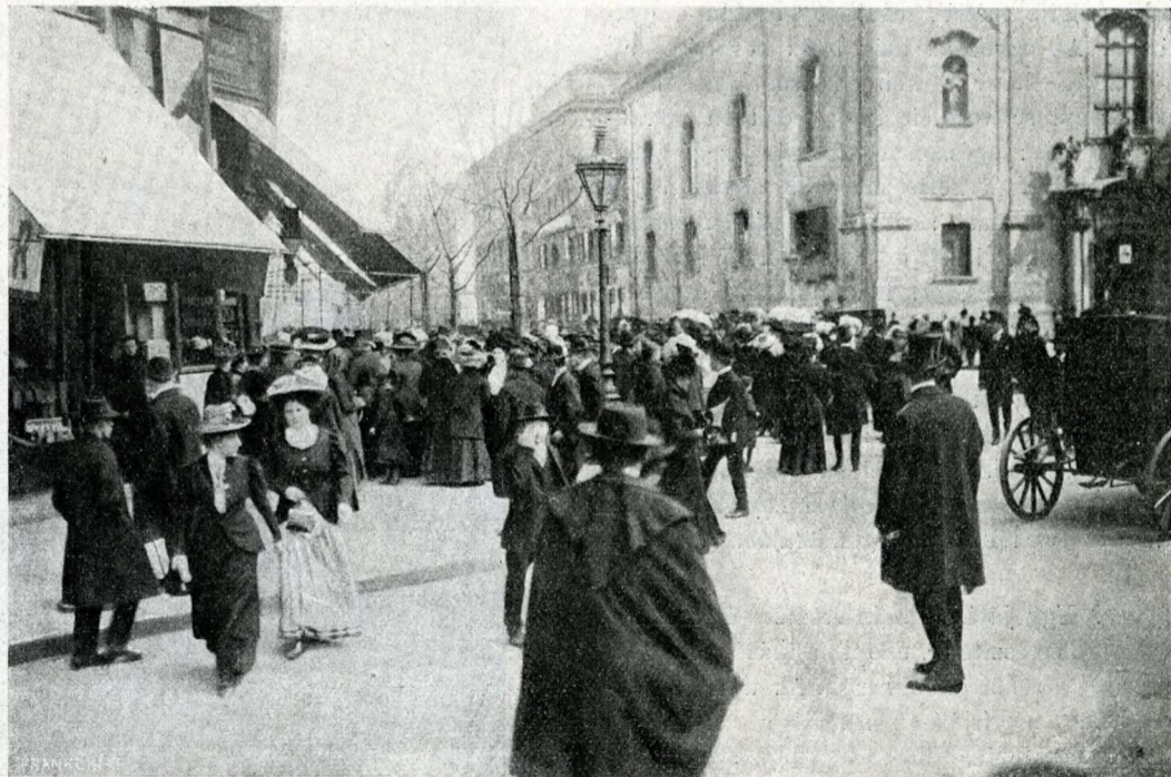
NÉPTÖMEG A KOSSUTH LAJOS-UTCZÁBAN.