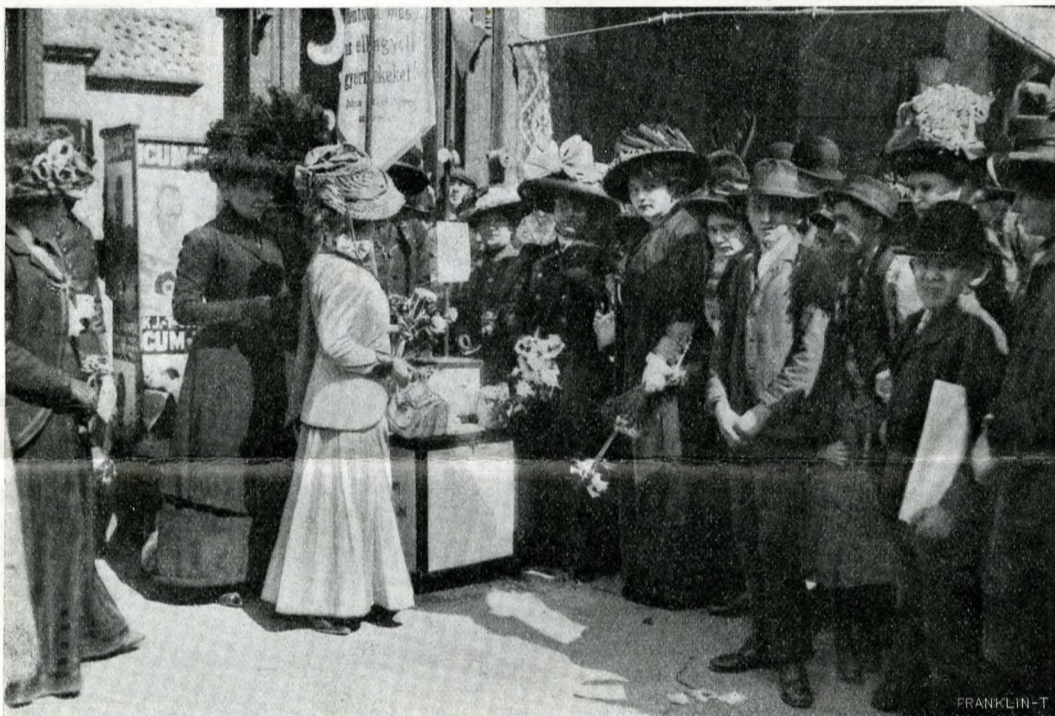
VIRÁG-ÁRULÓ HÖLGYEK A KOSSUTH LAJOS-UTCZA ELEJÉN.

kép mi ketten, én és te, voltunk együtt Burforddal. Erre ellenmondás nélkül azt kellett volna gondolnom: «Ime, minden ki van derítve. Montie barátom egészen úgy tett, mint Brown, nem tömi magát tojással a davosi jó levegőt élvezve, hanem e helyett kedves pajtásának Panhardján bejárja a Rivierát. Automobilt vezetni persze legújabb tanulatott, mert mikor utoljára láttam, azt se tudta még, mi a különbség a hajtósíj és bármily más géprész között. De akárhogyan is ez, nem töröm rajta a fejemet; e nélkül is elég gondom van nekem, mely elrabolja álmat.»