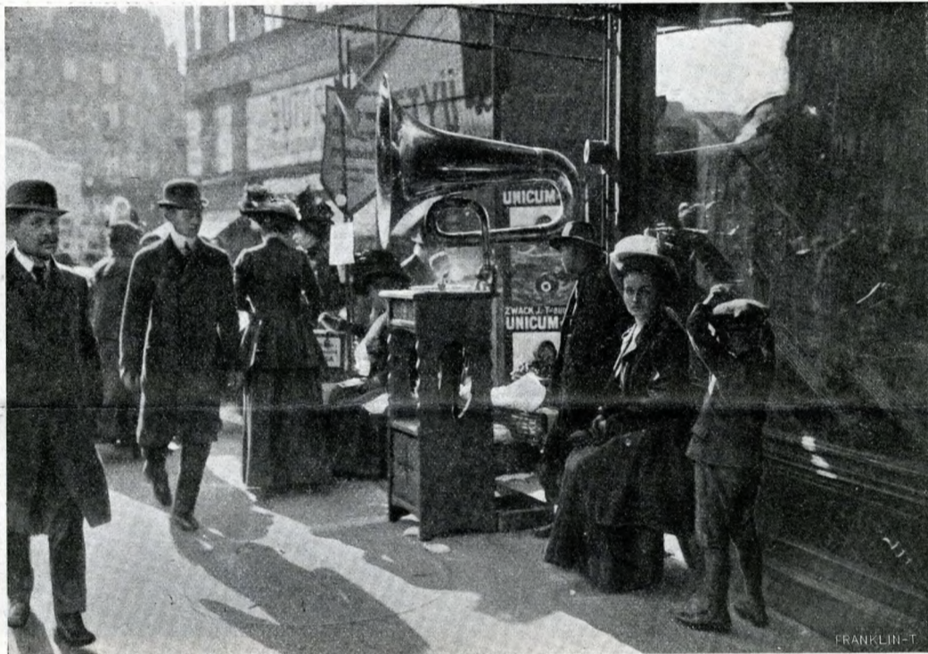
FONOGRÁF A KOSSUTH LAJOS-UTCZA ELEJÉN.

Miután tetőtől talpig végigmért, imigy folytatta: «Mit képzél ön, mondja meg nekem, hogy ide tolakodik úri társaságba, mintha köznék tartoznék? Mindjárt kivezettem a pinczékkel.» Eme meglepő kifakadás után sarkon fordult és a klubépület felé tartott. De tudod, hogy én nem vagyok a legszelidebb természetű, és Payne uram iránt, akár bolond, akár nem, valami különös szeretettel sem viseltetem. Ez egyszer hasznát vettem hosszú lábszáraimnak, melyekre annyi tréfás megjegyzést tett «Montie barátom», és feltartottam a távozót. Nem titkolom, hogy egyebet is tettem. Meg-