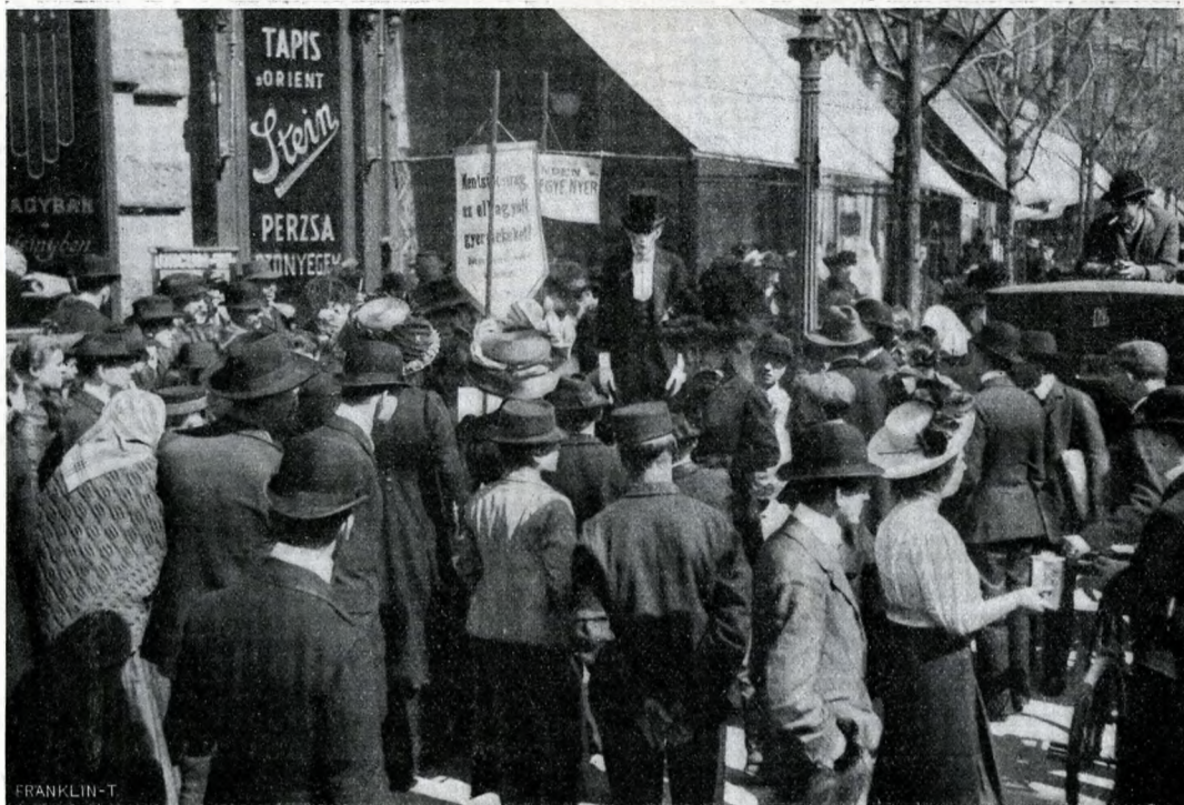
AUTOMATA-EMBER MUTATVÁNYAI A KOSSUTH LAJOS-UTCÁBAN.

vozni. «Szabad kérem, uram, — kezdé, — ha tetszik játszani, rendelkezésére állok. Épen elment egy barátom és csak mi ketten vagyunk jelen . . .»