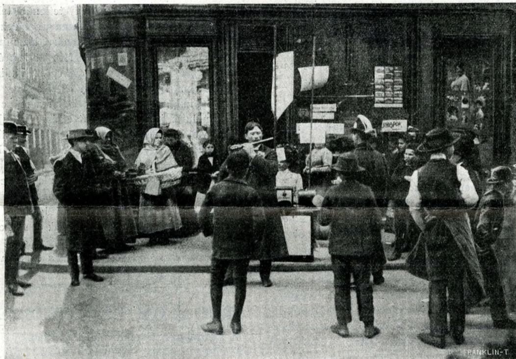
FLÓTÁS A VÁCZI-UTCZÁBAN.

Husvét. Ennek a mostani husvétnak az idő aktuális tartalmat is adott. Jézus föltámadásának ünnepe egy más föltámadást is ünnepelhetünk lelkünkben. Föltámadását a modern emberiség legnagyobb jóltevőjének, minden munka, minden haladás, minden fejlődés, minden boldogulás nemtőjének: az olajágas Békének. Már-már úgy látszott, hogy elveszítjük. Reátört a zivataros események ereje és a hosszú megkínóztatásban úgy elgyöngült, hogy már szinte-szinte élet se volt benne. Láttuk hadaknak fenyegető fölvonulását, borús és fekete ég alatt indultak el a hívó szóra tizezer számra erőteljes férfiak, rózsás arcú délceg leventék, fiaink, testvéreink, apa, férj, vőlegény oda, a hol a halál arat, garmadába döntvén a lekaszált életet. Keserves napokban aggódó szívünk kiállotta a megfeszített fájdalmát, míg azután — kiderült az ég és megint reánk mosolygott a feltámadott Béke sugárzó, nyájas arculata. Ez a sugárzás töltse meg